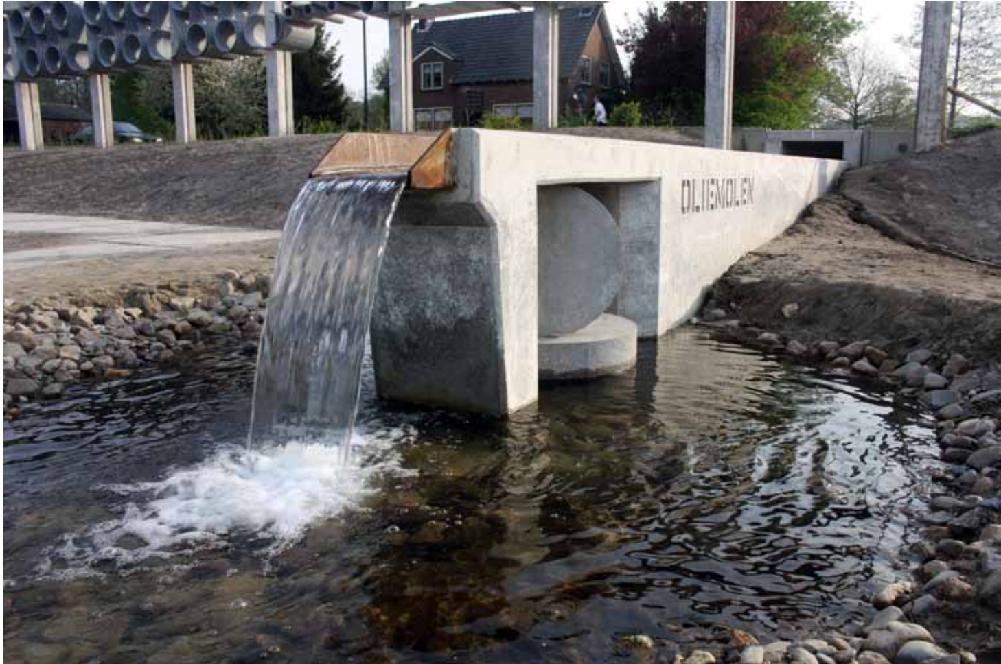
Speelplek in de Renkumse beek: beleefbare cultuurhistorie bij uitstek.

vels en celtic fields. In de Middeleeuwen was het Moftbos een domeinbos van de Staten van Gelderland. De restanten van het uit de 14e eeuw stammende Kasteel Grunsvoort, waar de drost van de Veluwe een tijd woonde, herinneren hieraan. Het bos was formeel beschermd tegen ontginning. Maar omdat boeren uit de omliggende buurtschappen gebruiksrechten op het gebied hadden, waren grote delen onderhevig aan degradatie als gevolg van beweiding en pluggen steken. Thans vormen oude enkeerdakertjes, heidevelden en boerengeriefhoutbosjes een herinnering aan hoe de natuur tot verna de Middeleeuwen voor boeren een geïntegreerd onderdeel van hun boerenbedrijf vormde. In de 19e eeuw ontwikkelde het gebied zich verder tot een landschap van landgoederen en buitenplaatsen. Door de aanleg van landschapselementen zoals tuinen, parken en lanen en van sierelementen zoals prielen en standbeelden gaven notabelen uiting aan hun identiteit. De landgoederen weerspiegelden een nieuwe fase in omgang met de natuur. Daarbij speelden niet alleen esthetische overwegingen een rol, maar ook ondernemerschap. Dat uitte zich in