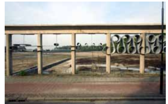
Kunstwerk in de oude muur van de papierfabriek. Op de achtergrond het herstelde beekdal waar enkele jaren geleden de papierfabriek stond.