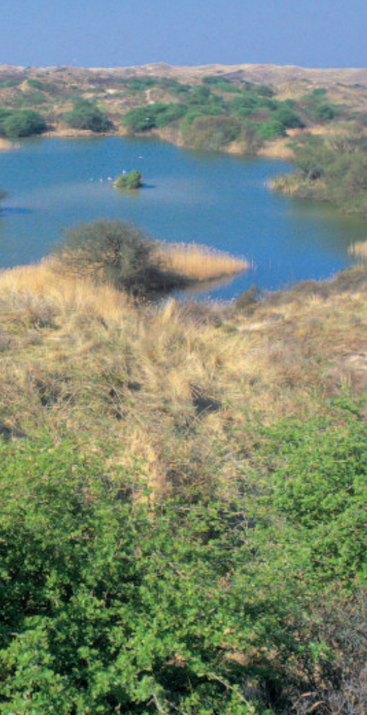
Synergie tussen een essentiële maatschappelijke functie en natuurbehoud: drinkwaterwinning in de duinen van Meijndel.

aanvulling op overheidsfinanciering een duurzame financiële bijdrage op basis van een systeem van rechten voorgesteld. Het verstrekken van het recht op een economische activiteit die mogelijk wordt gemaakt door natuur, wordt hierbij gekoppeld aan structurele financiële verplichtingen voor het duurzaam beschermen en beheren van deze natuur. Zo zou het mogelijk moeten zijn om recreatiebedrijven rondom een natuurgebied te verplichten bij te dragen aan de kosten van het beheer waarmee de natuur in stand wordt gehouden, die de bezoekers trekt.