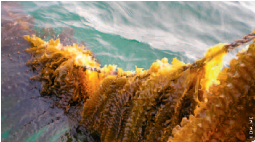
Macroalgen of wieren kunnen worden geteeld op lijnen in zee. Op de foto op p. 37 zien we een onderzoeker van de National University of Ireland een dergelijke lijn binnenhalen.

enkele tientallen meters lang worden. Zeewieren worden gegeten, vooral in Azië. Denk maar aan de Japanse sushi. Het is een belangrijke bron van eiwitten, vitamines, mineralen, ijzer, sporenelementen, omega 3- en omega 6-vetzuren