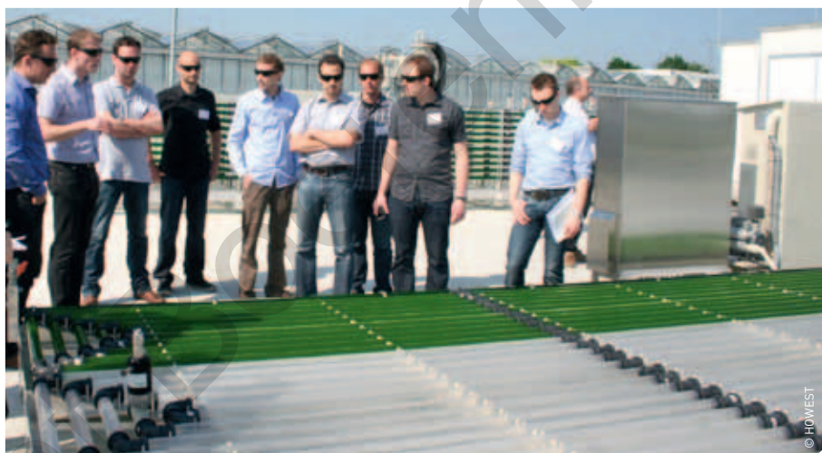
Op het onderzoekscentrum AlgaePARC bevinden zich deze gesloten horizontale fotobioreactoren voor microalgenteelt (zie pagina 38).

In tegenstelling tot land- en tuinbouwgewassen, worden algen momenteel nog veel minder nuttig gebruikt. Het is dus hoog tijd om de mogelijkheden van algen te ontdekken. Hiertoe moeten er wel nog vele vragen worden beantwoord. Welke algen zijn het best geschikt voor welke streken? Hoe worden ze geoogst? Kan je