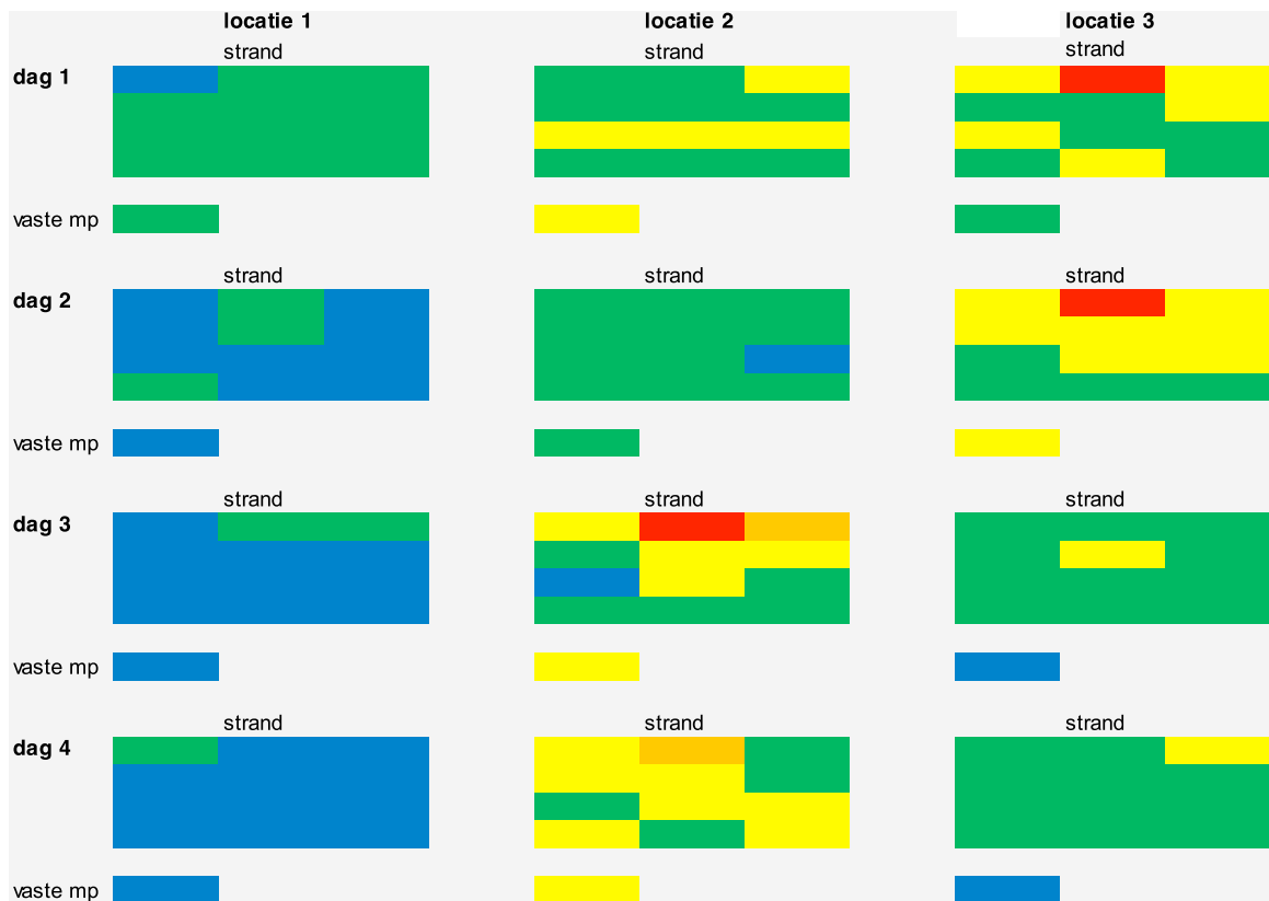
Afbeelding 2. E. coli -concentratie in grid vergeleken met het vaste meetpunt; blauw = onder detectielimiet, groen = 10 – 100 kve/100 ml, geel = 100-1000 kve/100 ml, oranje = 1000-2000 kve/100 ml, rood > 2000 kve/100 ml.

De resultaten laten zien dat de drie zwemplassen verschillen in E. coli -concentratie. Op locatie 1 is hij laag, op de locaties 2 en 3 is hij zeer variabel. Deze variatie is zowel ruimtelijk (de 12 monsters in het grid), als tussen de vier monsterdagen. De metingen in het grid laten zien dat de hoogste concentraties E. coli zijn gemeten in de zone het dichtst bij het strand (afbeelding 2).