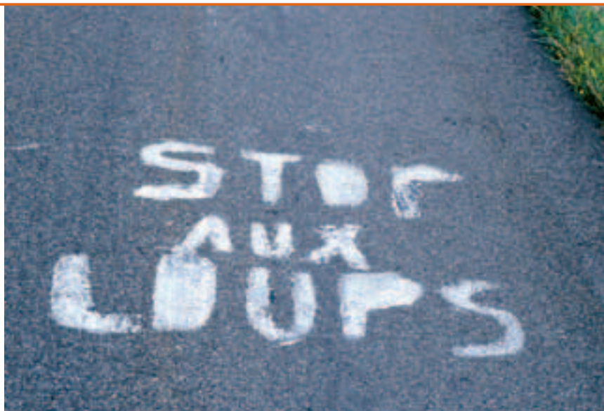
Protest tegen wolven op de Col de Menée, Drôme, Frankrijk.

velende situaties (Kleis, 2012): wilde zwijnen die tuinen binnendringen of natuurbezoekers lastig vallen in hun zoektocht naar eten. Dit type problemen heeft deels te maken met risicoperceptie. Wellicht hebben we te weinig respect voor de risico's die wilde zwijnen met zich me brengen en hadden deze problemen voorkomen kunnen worden als er wel een verantwoorde distantie tot deze dieren was bewaard. En misschien is onze angst voor de risico's van wolven wel overdreven.