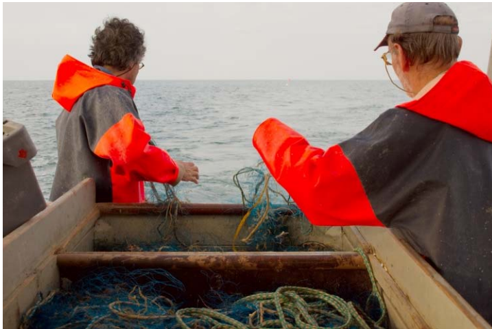
Het uitzetten van de netten.

De spiegelnetvisserij op kabeljauw en platvis gebeurt meestal in de winterperiode. Vissers zien kabeljauw vanaf half november tot eind december dichtbij de kust, tot enkele mijlen uit de kust. De kabeljauw trekt daarna richting dieper water om in januari en februari rond de wrakken (15-30mijl uit de kust) te verblijven. Eind februari, na de paaiperiode, zwemt de kabeljauw terug naar de kust om daar, afhankelijk van de watertemperatuur, tot half april te verblijven. Rond de wrakken worden strakke netten gebruikt, terwijl bij de overige visserij hierboven genoemd gebruik wordt gemaakt van spiegelnetten. Er zijn vissers die het hele visseizoen, soms wel jaarrond, rond de wrakken vissen. Deze vissers vangen in het zomerseizoen zeebaars rond de wrakken.