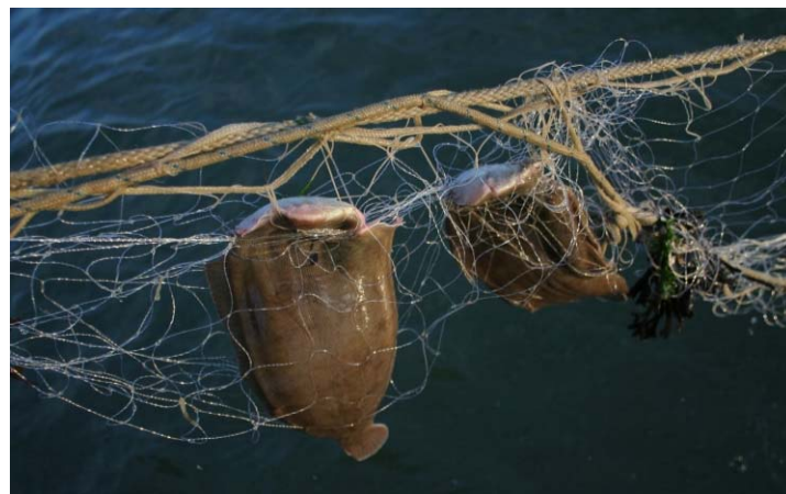
Tongen in de netten SCH61.

Voor de kabeljauwgerichte visserij met strakke netten rond de wrakken worden, afhankelijk van de grootte van het wrak, 1 tot 3 sets van 2 of 3 netten (in totaal 100-150meter) per wrak gebruikt. Maaswijdtes in deze visserij zijn groter dan 130mm. De statijd van deze netten is afhankelijk van het getij; na het kenteren van het tij worden de netten opgehaald. Het idee daarachter is dat tijdens de kentering de vis uit het wrak trekt om te foerageren en dat de netten dan de optimale hoogte hebben om de vis te vangen.