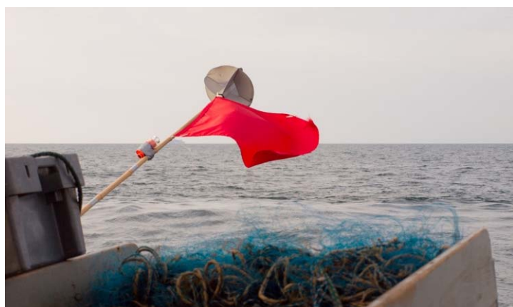
Achterdek KW2.

Deze informatiebrochure gaat over de standaardvisserij gericht op tong en de standaardvisserij met grotere mazen gericht op kabeljauw of platvis. Er zijn ongeveer 60 (kleine) vaartuigen die zich bezighouden met deze visserijen. Er is ook een standaardvisserij gericht op zeebaars, maar deze wordt hier niet besproken.