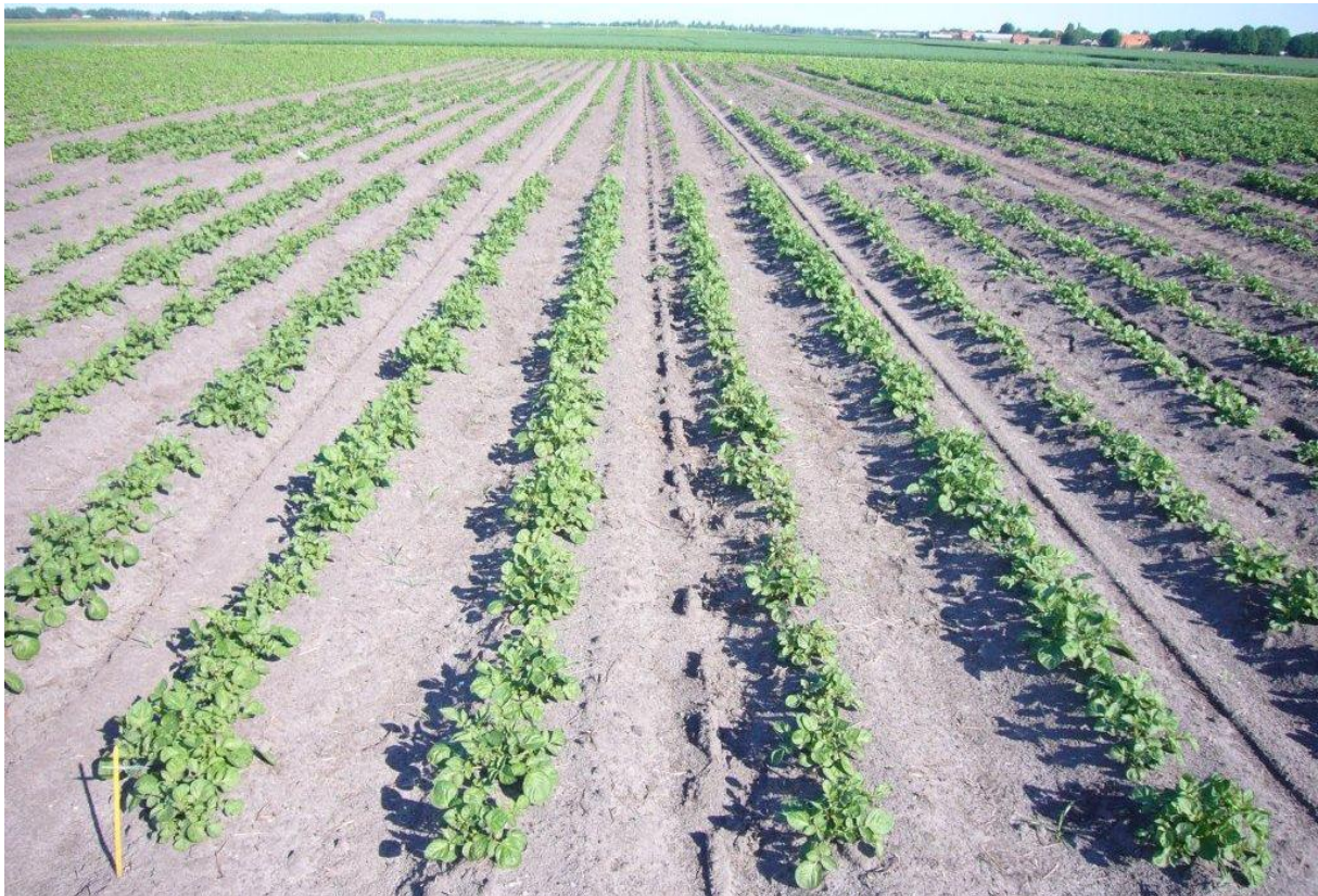
Afbeelding 1: Proefveld met verschillende rassen pootaardappelen ten behoeve van pootgoedvermeerdering

Ten behoeve van de rasvergelijkingsserie op de PPO locaties 't Kompas en Kooijenburg is voorgesteld om het onderzoek te verbeteren door de pootgoedvoorziening voor deze rasvergelijking centraal aan te pakken. Op deze wijze wordt er naast kennis van het ras voor de teelt van zetmeelaardappelen ook kennis voor de teelt en bewaring van het ras als (TBM)-pootgoed verzameld. Bovendien wordt de rasvergelijkingsserie als zodanig verbeterd, aangezien verschillende herkomst van pootgoed van grote invloed kan zijn op de (zetmeel)opbrengst.