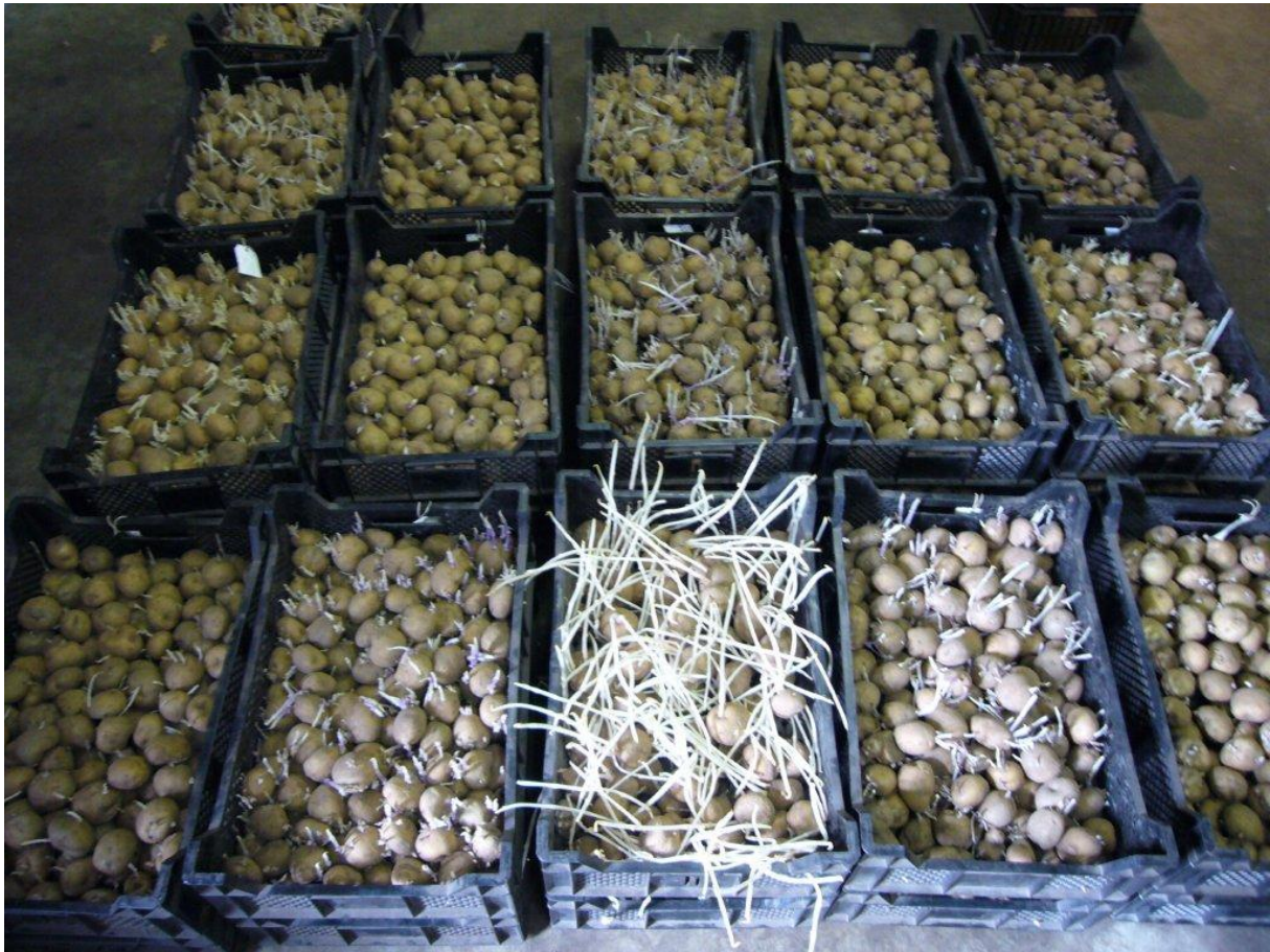
Afbeelding 3: Bewaarproef van pootgoed. De foto is gemaakt op 15 maart 2009. Te zien is het grote verschil in mate kieming tussen verschillende rassen.