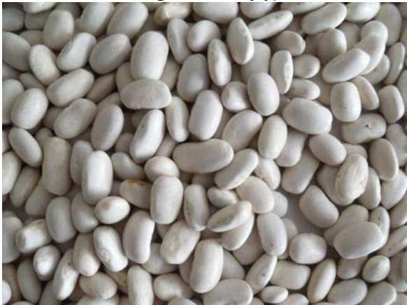
Witte boon (kidney type)

Dit type boon is een veel gebruikte boon. Commercieel gezien zal er zeker belangstelling voor zijn zowel voor industrieel als voor retail gebruik. Afzetmogelijkheden door heel de wereld. Producerende (en exporterende) landen van dit type boon zijn hoofdzakelijk China, Canada en USA. Deze bonen worden daarnaast overal in de wereld geteeld maar hoofdzakelijk voor binnenlands gebruik.