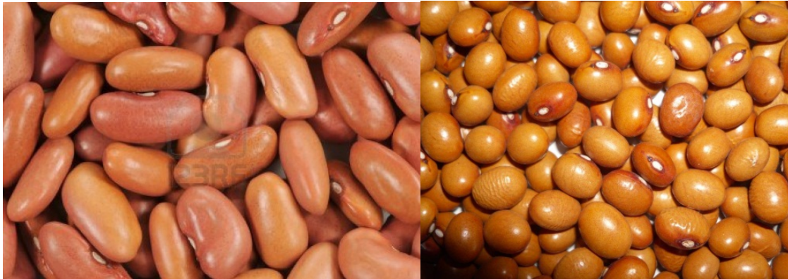
Ovale (kidney) type van de bruine boon links en het ronde type (kogelboon) rechts.

Voor conservegebruik wordt er in China het “roundshaped” type geteeld (= ronde boon/kogelboon). Alleen als dit type boon met andere conservenbonen kan concurreren is er commercieel belangstelling. In de conservenindustrie worden de ovale bonen wel eens vervangen door de ronde bonen maar dat gebeurt alleen als er een tegenvallende opbrengst is uit de contractteelt van de ovale. Commercieel gezien is de teelt van het ronde type niet erg interessant.