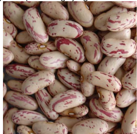
Gespikkelde bonen (kidney type)

Gespikkelde bonen worden door heel de wereld in alle mogelijke variëteiten geteeld. Belangrijk is of de boon zijn kleur behoudt na wellen en koken, want dit bepaalt het uiteindelijke gebruik. Veelal (ver)kleuren de gespikkelde bonen na bewerking bruin en dit type boon is na bewerking dan ook gelijkwaardig aan de bruine boon en de pintoboan. Voor West Europees gebruik is dit de conservenboon bij uitstek. De productie vindt hoofdzakelijk plaats in China en de gespikkelde boon is veelal de goedkoopste in vergelijking met de pintoboan en de bruine boon. Daardoor is er veel export naar Afrika en Azië. Prijs uiteraard afhankelijk van vraag en aanbod. Van oogst 2012 was de prijs van de Pinto bonen voor het eerst in prijs lager dan de light speckled, dit vanwege lagere opbrengsten in China en een hogere productie in de USA. Commercieel gezien zal er zeker interesse zijn in in Nederland geteelde gespikkelde bonen, maar de vraag blijft of Nederlandse telers met de Chinese, Canadese en Amerikaanse telers kunnen concurreren.