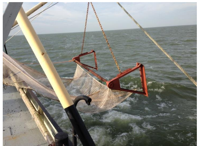
Uitzetten 4 meter kor op IJsselmeer

Tijdens de bestandsopname zal zowel met de 4 m boomkor (43 trekken gericht op schubvissoorten) als met de elektrokor (60 trekken gericht op aal en schubvis) worden gevisd. De resultaten worden gebruikt bij de beoordeling en advisering van de visserij op o.a. aal, spiering, baars en snoekbaars, in analytische studies van de interacties tussen het waterbeheer, de visstand, de vogels en de visserij en bij de beoordeling van de ecologische toestand in het