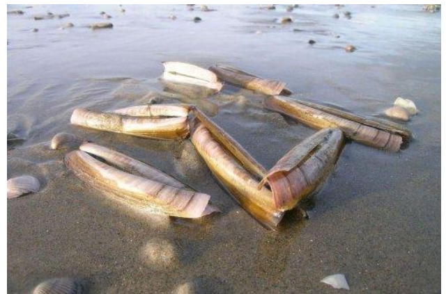
Mesheften ( Ensis )

Het onderzoek in de ondiepere delen van de Voordelta wordt uitgevoerd met een gecharterd kokkelvaartuig. In het resterende gebied wordt met een schip van de Rijksrederij gevist. De bemonsteringen worden uitgevoerd gedurende 9-10 weken in de maanden april – juni. Er wordt gevist met verschillende tuigen, afhankelijk van diepte en substraat: een bodemschaaf, een aangepaste zuigkor en een Van Veen happer. De monsterpunten zijn over het onderzoeksgebied verdeeld volgens een gestratificeerd grid, waarbij voor een efficiënte verdeling van de onderzoeksinspanning het gebied is verdeeld in een aantal strata: gebieden met een verschillende kans of verwachting op het voorkomen van mesheften, strandschelpen en kokkels (met name in de Voordelta). De indeling is daarbij gebaseerd op informatie uit eerdere bestandsopnames. In strata waar veel schelpdieren worden verwacht, is een fijner grid bemonsterd dan in strata waar lage dichtheden verwacht worden. In totaal worden in de gehele Nederlandse kustzone zo'n 850 locaties bemonsterd, waarvan 200 in de Voordelta.