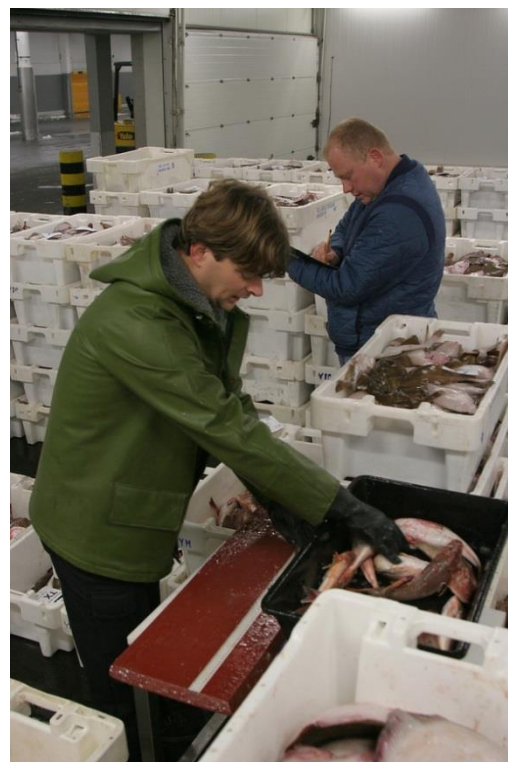
Vis meten tijdens afslagbemonstering

Door middel van bemonstering van de aanvoer van de visserijvloot wordt informatie verzameld die, met soortgelijke informatie verzameld door andere landen, gebruikt wordt bij het analyseren van de toestand van de visbestanden in zee. De resultaten van deze analyses vormen de basis voor de adviezen aan EZ voor het beheer van de visserij in de Noordzee en Noordoostelijke Atlantische Oceaan.