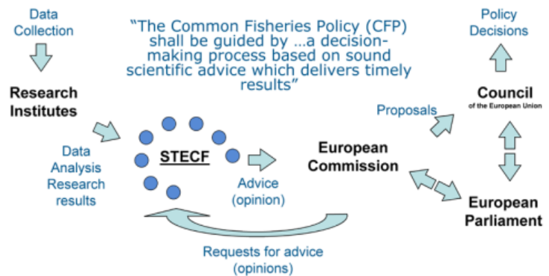
Position of STECF in CFP

Oostenbrugge (LEI) is het huidige Nederlandse lid. In 2015 wordt een nieuw comité geïnstalleerd. Door de EC is een proces in gang gezet om nieuwe leden in het comité te benoemen. Indien een expert van IMARES in het nieuwe comité wordt opgenomen, moet hiervoor middelen beschikbaar zijn, hierop is in de begroting geanticipeerd voor twee personen. Er worden vanuit dit programma tevens bijdragen geleverd aan de STECF expertgroepen in 2015.