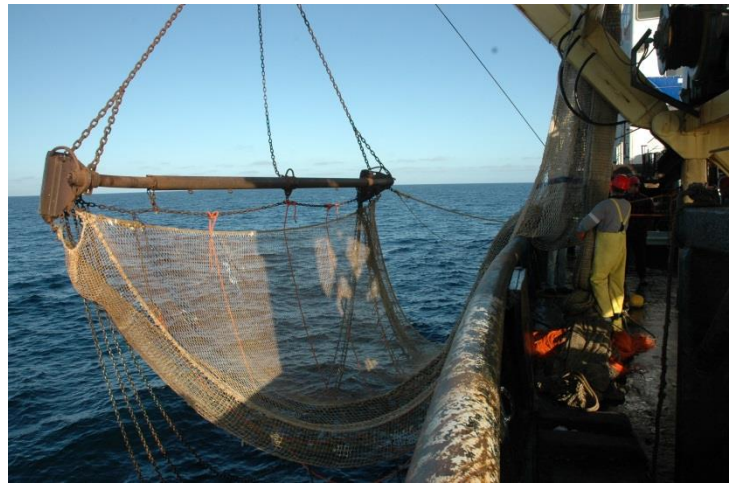
Uitzetten boomkor op de Tridens

De Beam Trawl Survey (BTS) wordt in de periode augustus/september uitgevoerd, door de Isis in de zuidoostelijke Noordzee (5 weken) en door de Tridens in de westelijke en centrale Noordzee (4 weken). Het standaard vistuig voor beide schepen is een 8-meter boomkor. Doel van deze survey is het verkrijgen van visserijafhankelijke schattingen van de dichtheid van de meest algemene (oudere) leeftijdsgroepen van commerciële soorten, waaronder tong en schol ten behoeve van de toestandsbeoordeling van deze soorten door ICES. Behalve gegevens over demersale vissoorten levert deze survey ook unieke gegevens over het voorkomen van macro-epibenthos in het onderzoeksgebied, welke kwantitatief goed wordt bemonsterd.