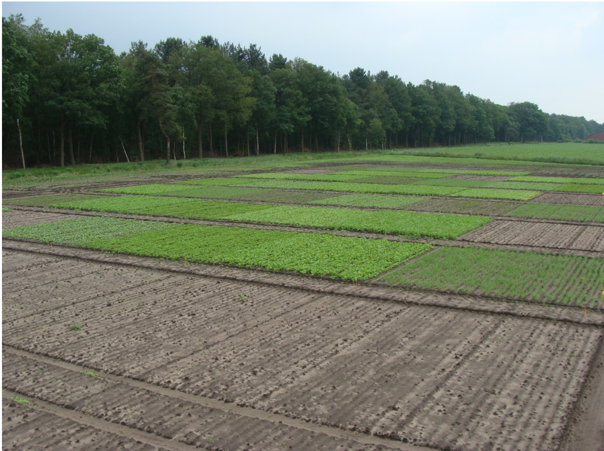
Foto 3a. Proefveld waardplantgeschiktheidsonderzoek groenbemesters, 12 juni 2012, Vredepeel.

De verschillende groenbemesters zijn op 22 mei 2012 gezaaid. Opkomst, begin juni, was bij alle gewassen goed (zie foto 3). Rond 20 juni is de bodembedekking bij alle groenbemesters bijna volledig (100%), met uitzondering van zwaardherik ras Trio. Dit gewas/ras is wat trager en heeft een bodembedekking van circa 50%. Begin juli is de bodembedekking bij dit object ook 100%.