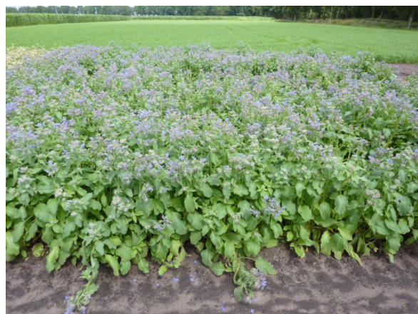
Foto 3c. Borago