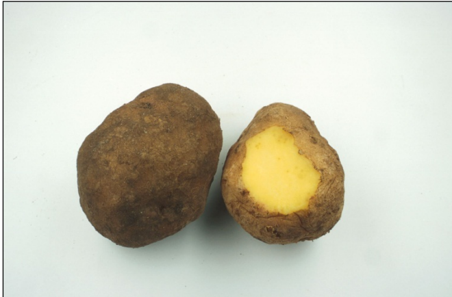
Foto 2. Uitwendige (knobbels) en inwendige (ei-pakketten) symptomen van Meloidogyne chitwoodi bij aardappel.