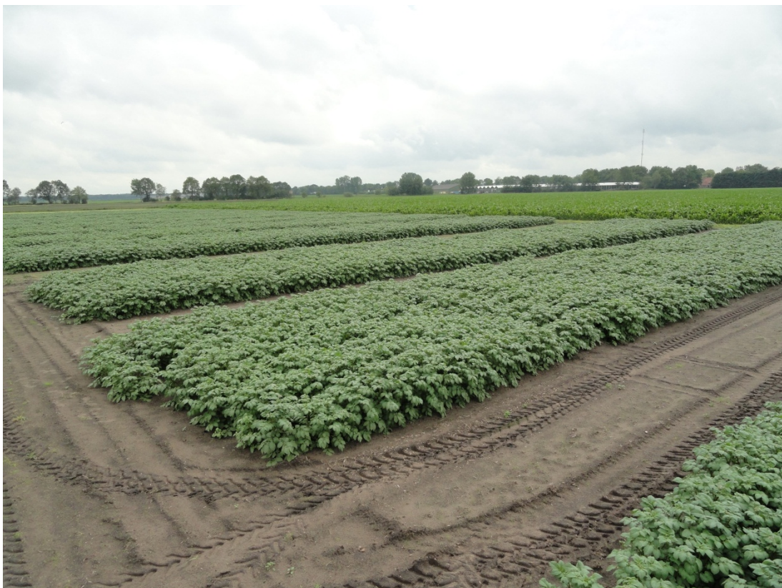
Foto 4. Overzicht proefveld, nateelt aardappelen, juni 2013.

Na de teelt van de groenbemesters (2012) is in 2013 op alle de groenbemesters-veldjes het toetsgewas aardappel geteeld (foto 4). De aardappel ras Asterix zijn op 24 april gepoot. Opkomst en gewasontwikkeling was goed en er waren geen verschillen tussen objecten zichtbaar. Rond half juni was de bodembedekking in alle veldjes circa 60% en begin juli was de grond in alle veldjes volledig bedekt. Eind oktober zijn de aardappelen geoogst en is per veldje de opbrengst en kwaliteit, mate van knolaantasting door M. chitwoodi , bepaald.