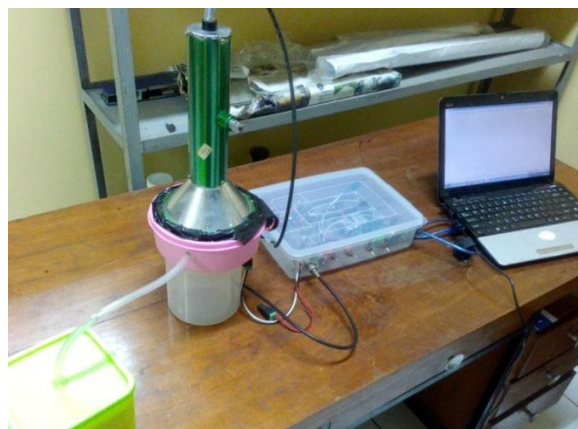
Gambar 4. Pencacahan radon lepasan dari bahan bangunan

Pengukuran cacahan monitor gas radon untuk dua kondisi yaitu ruang detektor terbuka dan ruang detektor terhubung dengan ruang radon, sebagaimana diperlihatkan pada Gambar 4. Jumlah cacahan per detik (cps) ketika ruang detektor terhubung dengan ruang radon lebih tinggi (0,089 cps) daripada cacahan dalam kondisi ruang detektor terbuka (0,076 cps). Artinya terdapat 0,013 cps dari gas radon lepasan ruang radon yang diisi bahan pasir zirkon. Nilai cacahan 0,013 cps atau 13 cacahan per 1000 detik artinya terdeteksi 13 partikel alfa berinteraksi dengan detektor dalam waktu 1000 detik. Karena 1 gas radon memancarkan 1 partikel alfa maka berarti 13 gas radon yang meluruh dan memancarkan partikel alfa yang mengenai detektor dalam waktu 1000 detik. Karena satuan untuk konsentrasi gas radon adalah Becquerel per liter (Bq/L) atau jumlah peluruhan gas radon per detik per satuan volume liter maka 13 gas radon yang meluruh dalam 1000 detik dalam 750 mL volume ruang detektor, dapat dikatakan konsentrasi gas radon adalah 0,017 Bq/L.