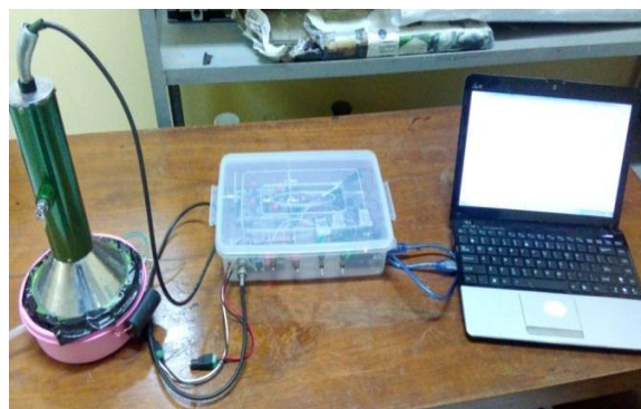
Gambar 2. Komponen dan perangkat elektronik monitor gas radon

Telah dibuat monitor gas radon dengan detektor sintilasi dan perangkat elektronik sebagaimana diperlihatkan pada Gambar 2. Detektor sintilasi menggunakan bahan ZnS (Ag) model PAS-9 produk Technical Associate dilengkapi tabung PMT dengan tegangan operasi 800 volt. Sebuah ruang berupa wadah terbuat dari bahan polietilen diameter 14 cm dan tinggi 5 cm (volume 750 cm 3 ) yang berfungsi melewatkan udara ke detektor dilengkapi dengan elektroda positif pada dasar ruang dan elektroda negatif pada permukaan detektor. Perangkat elektronik dalam wadah polietilen transparan adalah terdiri dari rangkaian tegangan tinggi untuk detektor, penguat awal, regulator tegangan, arduino dan baterai. Sumber tegangan tinggi detektor berupa rangkaian dioda pelipat tegangan dari sumber listrik DC 3 volt menjadi tegangan tinggi DC 800 volt. Penguat awal yang digunakan tipe peka muatan model 2005 produk Canberra dengan sensitivitas 4,5-22,7 volt per nano Coulomb. Regulator tegangan DC-DC dengan input 9 volt (baterai) dan output +24 V, +12 V, -24 V, -12 V dipasang sebagai power suplai penguat awal. Arduino Uno digunakan untuk membaca jumlah pulsa yang dihasilkan dari penguat awal.