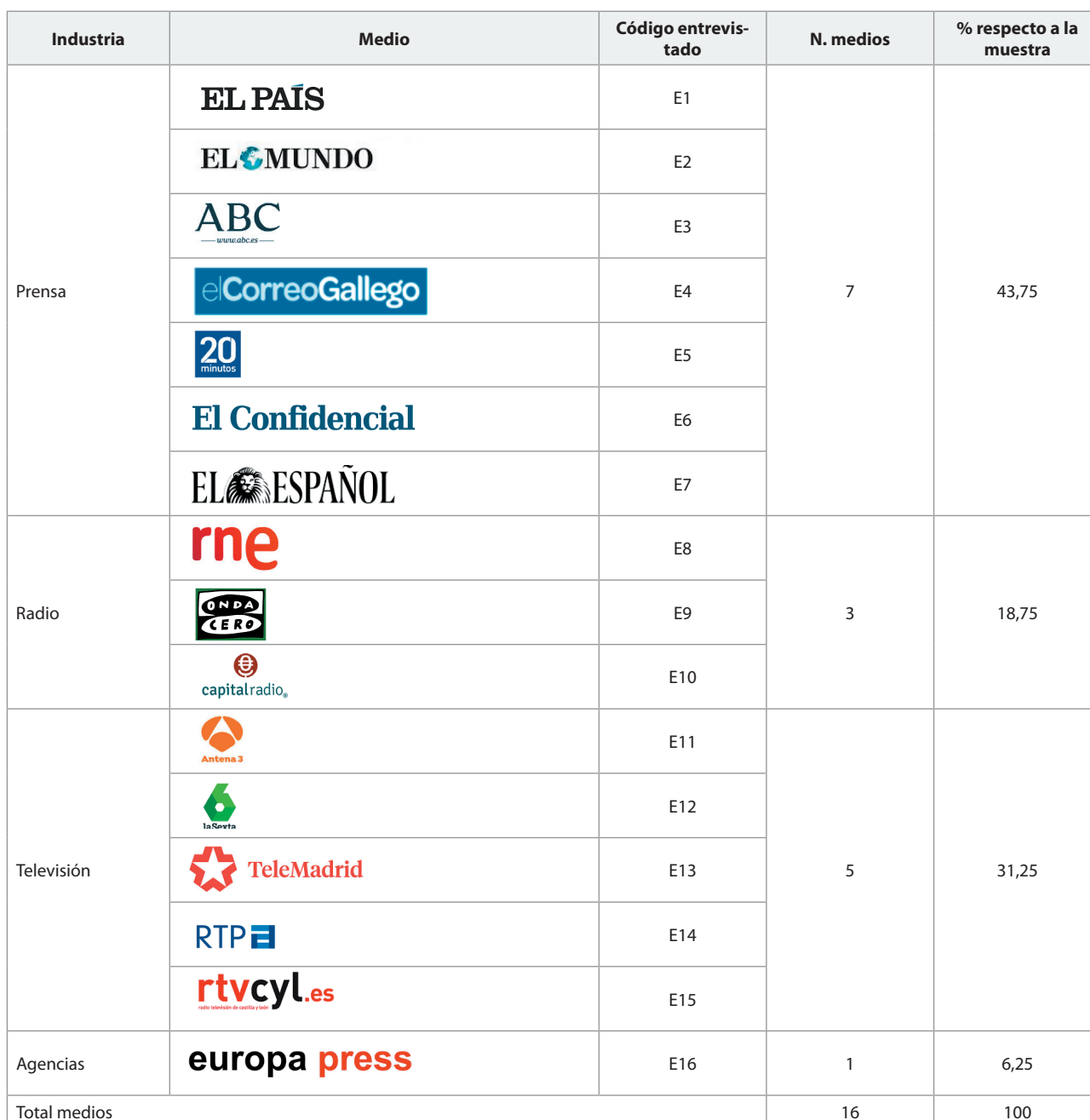
Tabla 1. Medios participantes en el estudio

La tabla 1 muestra los medios que toman parte en este trabajo.