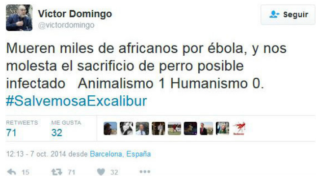
Imagen 4. Tuit que ahonda en la dicotomía entre humanismo y animalismo.