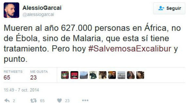
Imagen 3. Tuit crítico con el “espacio común” de la conversación.

Fase de desestructuración: aparecen escasos tuits en los que se realizan críticas a la especial atención que se puso en el caso de la mascota de la auxiliar de enfermería Teresa Romero, el perro Excalibur. Estos son algunos ejemplos: