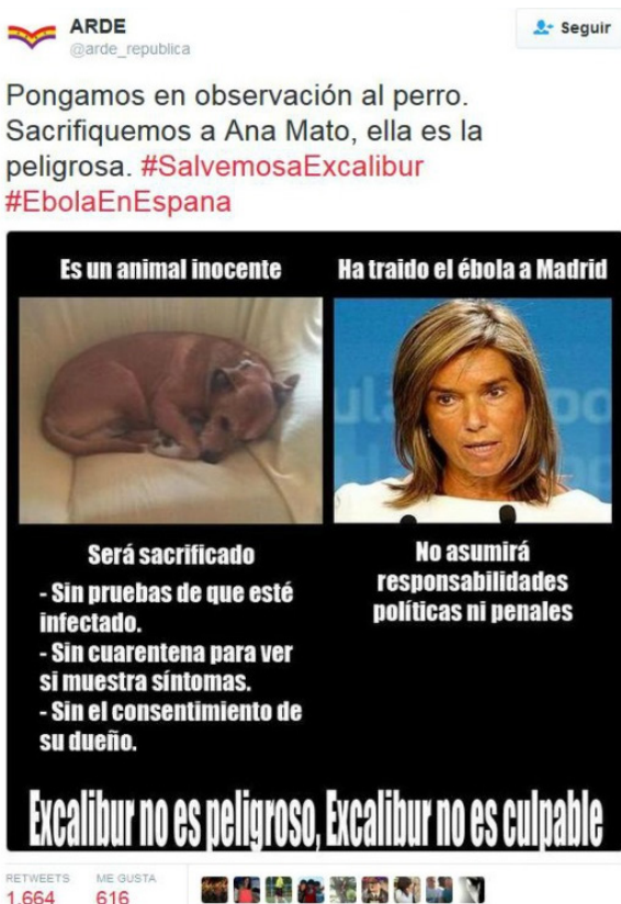
Imagen 1. Ejemplo de mensaje que se enmarca en la fase de interés.

Fase de interés: en esta emergencia abundan las bromas, los mensajes sarcásticos y las duras críticas que tienen por objetivo atraer la atención hacia el propio emisor de estas. Este tipo de mensajes son publicadas principalmente por perfiles ciudadanos tanto de tuiteros como de ciberactivistas. Algunos ejemplos: