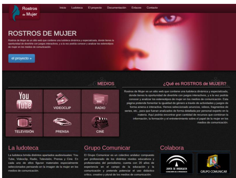
Figura 1: Portada de “Rostros de mujer”

Aparece aquí una definición de “Estereotipo” para situar al usuario en el ámbito de actuación del proyecto, cuyo objetivo también se presenta en esta primera página. En la parte superior se ofrecen seis pestañas, a modo de índice, que permiten el acceso a cada una de sus partes: ludoteca, el proyecto, documentación, enlaces y contacto, además de inicio. En la parte izquierda se presentan la pestaña “proyecto” que facilita