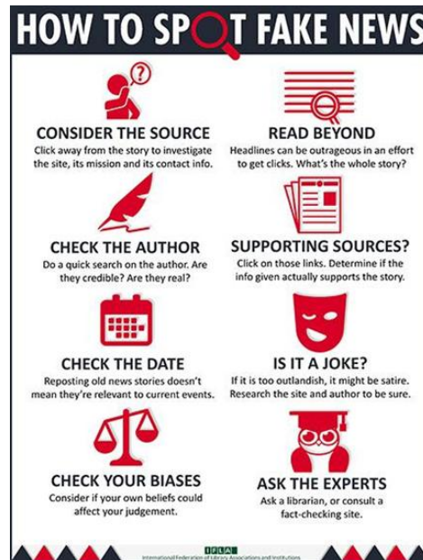
Figura 2. Infografia creada per IFLA per a lluitar contra les notícies falses. Font: https://www.ifla.org/publications/node/11174

Com apunta López-Borrull (2017), pot ser de gran utilitat, sobretot perquè té aquella viralitat per arribar on s'estan difonent informacions poc acurades o falses, directament. Segons definició de la pròpia IFLA, "... una simple però efectiva eina que ofereix una alternativa, basada en la convicció de que l'educació és la millor forma que els usuaris adquireixen confiança i de que els governs no disculpin una censura innecessària." La infografia ha tingut un gran impacte a escala mundial, ha estat notícia a la CNN Internacional entre d'altres mitjans. El moviment bibliotecari no ha tingut aturador: la biblioteca del Parlament de Finlàndia va presentar-la en una reunió parlamentària; a Suècia, Alemanya, Vietnam o Malàisia com cita la IFLA i, també a Catalunya, s'ha fet difusió i s'han penjat cartells o fet pòsters o organitzats debats i s'ha generat articles i publicacions. Com a exemple, citem la conferència sobre "notícies falses" a la festa de la XBM (Xarxa de Biblioteques Municipals de la Diputació de Barcelona) celebrada a mitjans de febrer d'enguany. I a les recents (març 2018) XXIV Jornades de Comunicació Blanquerna (Universitat Ramon Llull) s'ha centrat en la "postveritat".