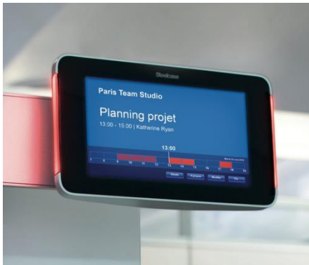
Figure 4 : Tablette tactile pour la réservation de salles de travail collaboratif à SupAgro

équipement informatique et téléphonique 77 . Le futur aménagement de la bibliothèque favorisera donc l'utilisation des ressources numériques : plus de prises électriques qu'à présent, création de nouveaux postes informatiques, réseau Wi-Fi, tableaux interactifs, salles de visio-conférence, prêt du matériel informatique et audiovisuel, etc.