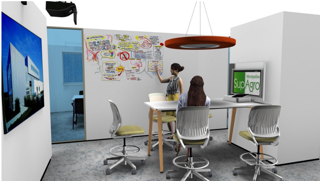
Figure 5: Salle de travail collaboratif dans le futur learning center de SupAgro

L'un des principaux objectifs pédagogiques de l'opération est de favoriser la réussite des étudiants en mettant le numérique au service des apprentissages 78 et de faire émerger une véritable culture numérique 79 . Selon la note d'information sur les ressources pédagogiques et documentaires de Montpellier SupAgro (cf. Annexe n°1, p. 54), les ressources électroniques payantes et gratuites, proposées par ses bibliothèques, ont des formats différents et sont dispersées sur diverses plateformes. La mise en place d'un point d'accès unique aux ressources documentaires et pédagogiques permettant de valoriser les ressources, d'augmenter leur utilisation et de rendre la recherche d'information plus ergonomique et plus puissante paraît donc légitime.