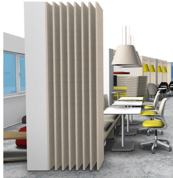
Figure 3 : Espace ouvert du futur learning center de SupAgro

De plus, l'équipe de la bibliothèque, formée en interne à l'utilisation des outils numériques, sera renforcée par la présence permanente d'un informaticien. Ce dernier aura le rôle d'animateur dans les espaces de travail. Il accompagnera les étudiants et les enseignants à l'expérimentation de nouvelles technologies d'apprentissage et d'enseignement (tournage de vidéos, conception et rédaction de modules de cours, jeux sérieux, utilisation de tableaux interactifs, ...).