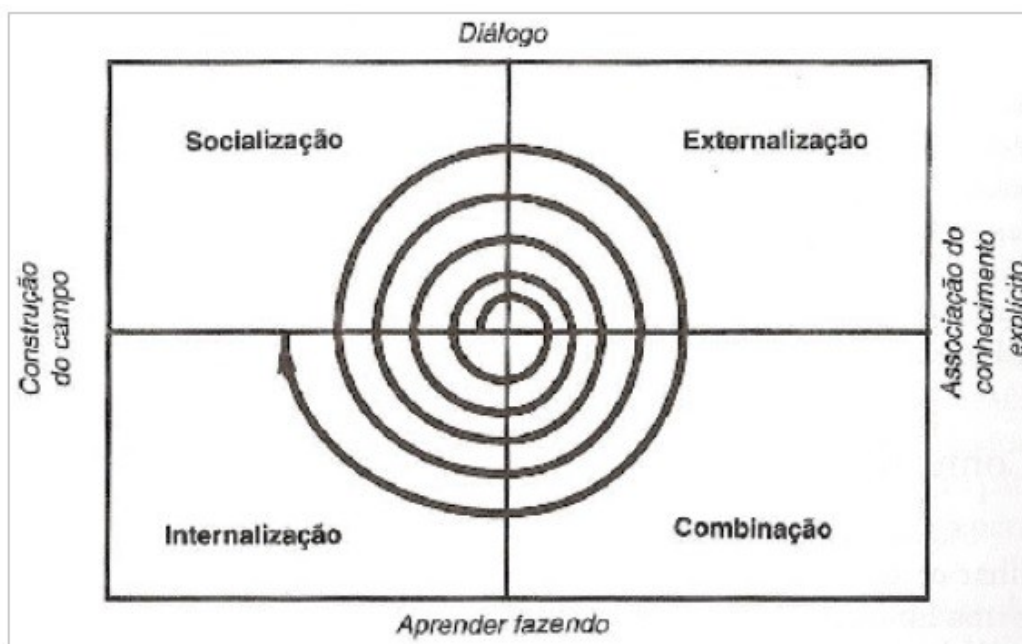
Figura 2. Espiral do conhecimento – Modelo SECI

Inerente à mente humana, o conhecimento é o elemento mais complexo do processo informacional. Depende do contexto, de reflexão, de análise e de síntese. Esse modelo, formalizado por Nonaka e Takeuchi (1997) na espiral do conhecimento, pode ser comparado ao processo do ciclo informacional, se considerar o mecanismo pelo qual a coleta de dados, sua externalização e combinação para a produção de informação será internalizada como construção de novo conhecimento em um momento posterior, o que poderia marcar o final da primeira volta do ciclo. A ativação de novos dados, novamente externalizados e combinados dão origem a nova informação e, quando internalizados, na continuação do ciclo, constroem um novo patamar de conhecimento. A cada volta da espiral, novas informações, novo conhecimento e, portanto, novos dados são produzidos.