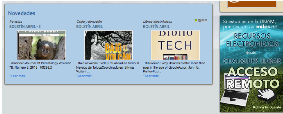
Figura 2. Parte inferior de la página inicial

La segunda sección de la página involucra la presentación de la biblioteca y parte de su historia, así como el acceso a la descripción de sus principales colecciones. Cabe destacar que no importa en qué sección de la página se esté navegando, siempre está presente el acceso a los catálogos de la biblioteca.