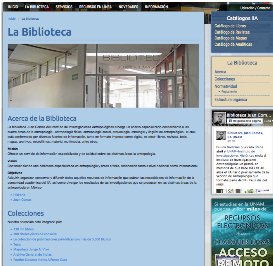
Figura 3. Acerca de la biblioteca

La segunda sección de la página involucra la presentación de la biblioteca y parte de su historia, así como el acceso a la descripción de sus principales colecciones. Cabe destacar que no importa en qué sección de la página se esté navegando, siempre está presente el acceso a los catálogos de la biblioteca.