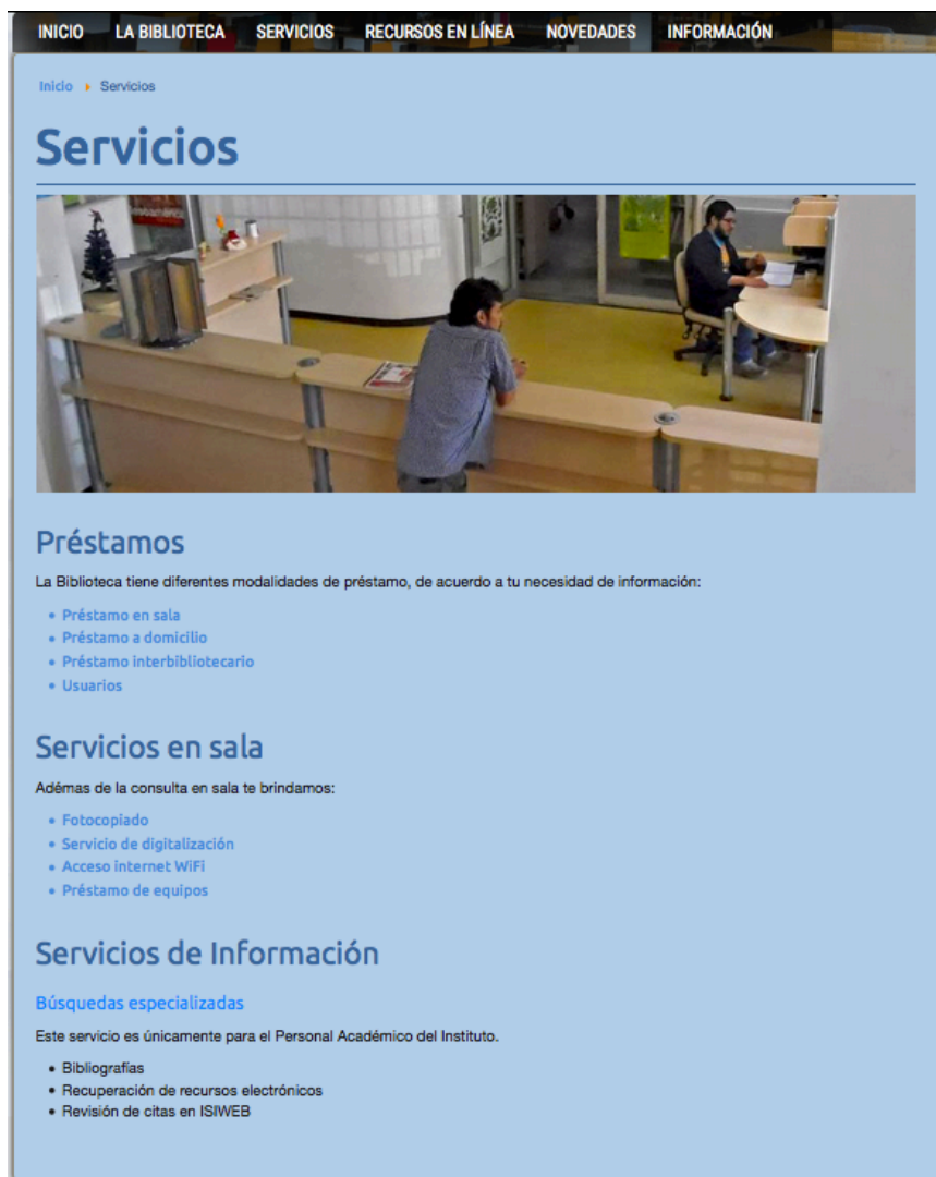
Figura 4. Servicios

La tercera sección de la página muestra los principales servicios que brinda la biblioteca y una breve descripción sobre en qué consisten estos servicios.