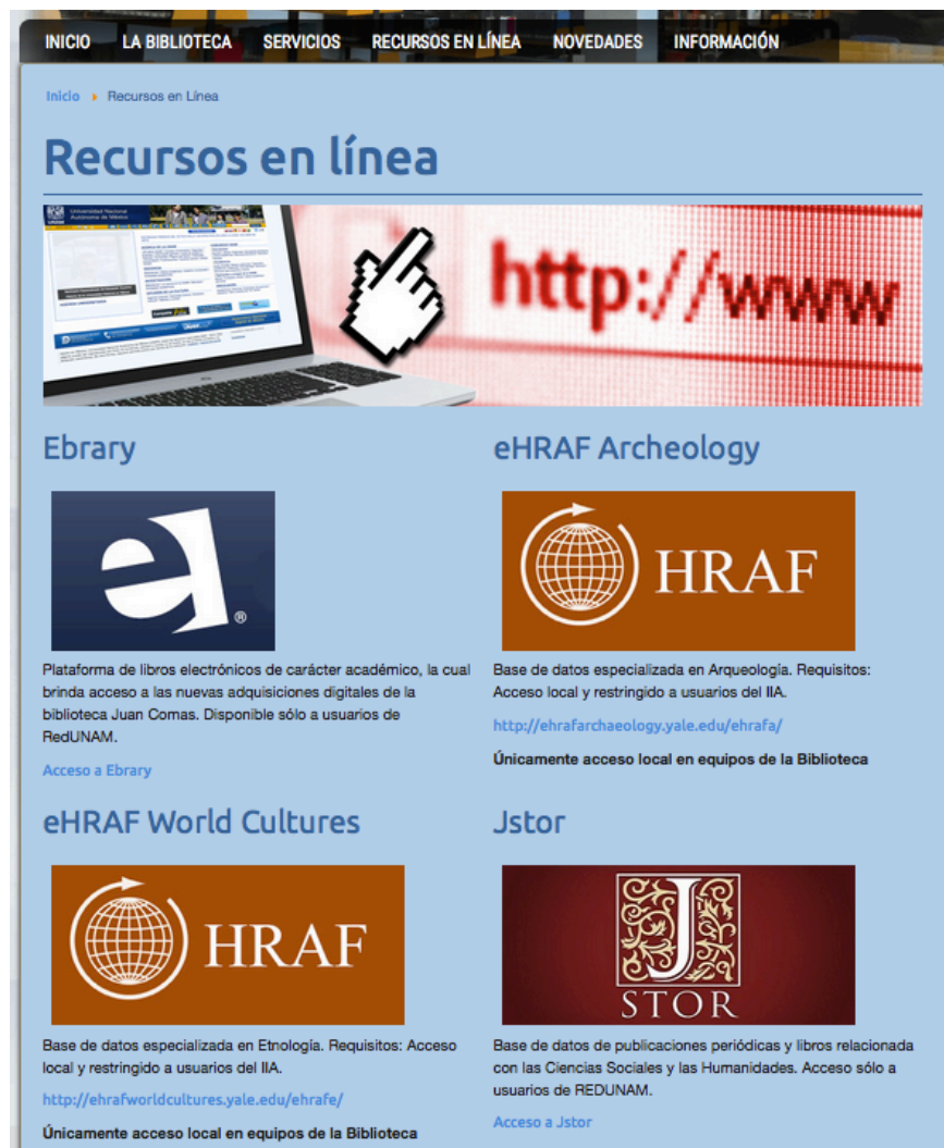
Figura 5. Recursos electrónicos

A continuación una parte importante del sitio web de la biblioteca, los boletines de novedades que están disponibles tanto para los usuarios internos como externos. Estos boletines dan cuenta de las nuevas adquisiciones de libros, revistas y otro tipo de documentos, así como de la descripción de materiales que están siendo trabajados en distintas áreas de la biblioteca, como por ejemplo, el área de Fondos Documentales Alfonso Caso. Estos boletines se publican quincenalmente y están disponibles para su lectura en todo momento. También cabe mencionar que su elaboración es una tarea conjunta entre 5 académicos de la biblioteca, situación que a la fecha ha resultado novedosa y práctica porque cada uno de los que integran esta sección se hace responsable