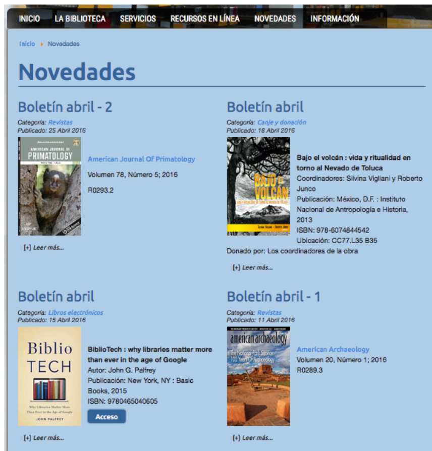
Figura 6. Novedades bibliohemerográficas

directamente de la publicación de su propio contenido.