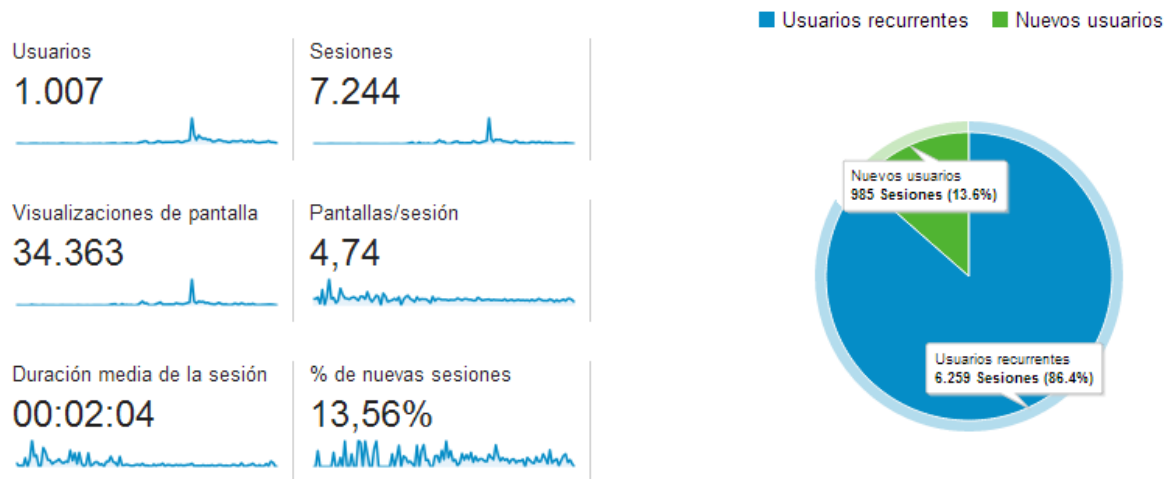
Ilustración 4: estadísticas generales de la app 2014 - Q1

descubrimiento de la app. Lo importante de dicho dato será ver si con el paso del tiempo se mantiene o no en esa línea, de forma que nos vaya dando señales del interés que despierta en los usuarios.