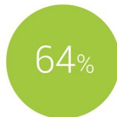
Ilustración 1: Uso de Internet móvil y principales usos de los smartphones (Elaboración propia a partir de diferentes fuentes)