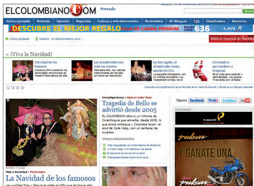
El colombiano, http://www.elcolombiano.com/

Los medios de la tabla 7 se ubican en puestos privilegiados de liderazgo en Colombia, quedando