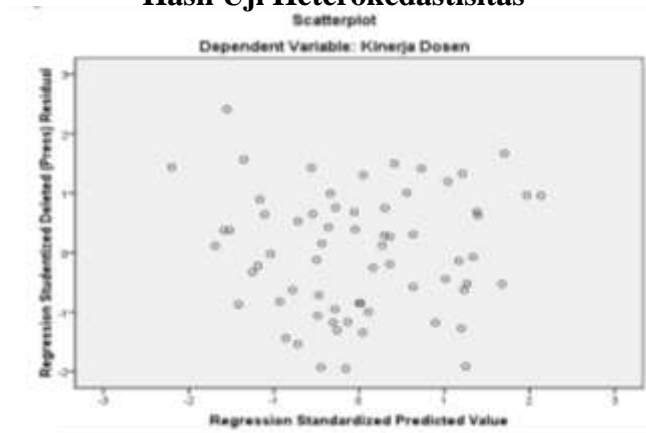
Gambar 5.2 Hasil Uji Heterokedastisitas

Gambar memperlihatkan titik-titik menyebar secara acak, tidak membentuk pola yang jelas/teratur, serta tersebar baik diatas maupun dibawah angka 0 pada sumbu Y. dengan demikian “tidak terjadi heterokedastisitas” pada model regresi.