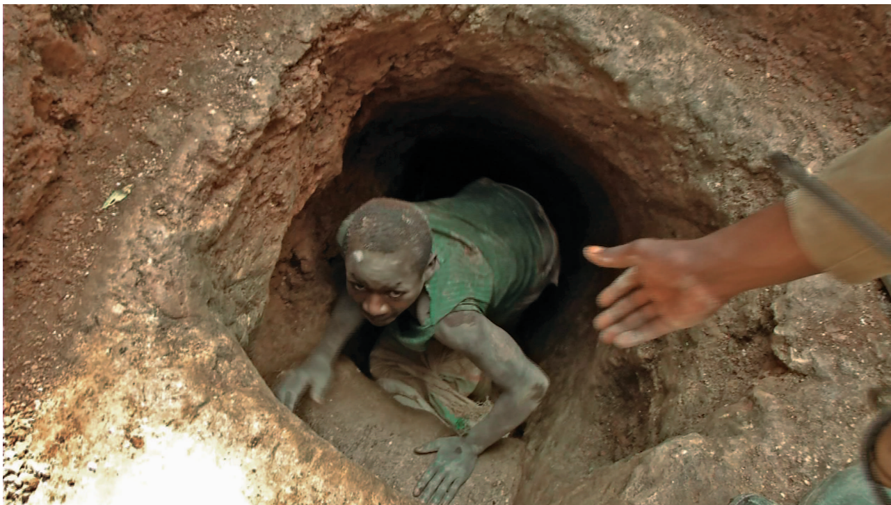
Fig. 1. Imagen del programa documental En Tierra Hostil , de Antena 3 TV, dedicado a El Congo.