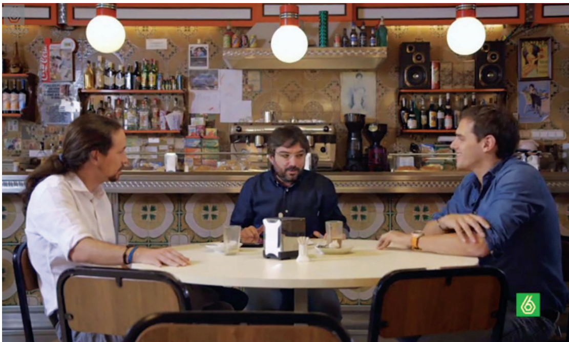
Fig. 6. Fotograma del programa documental Salvados , de La Sexta.

- Presiones gubernamentales: la Administración Pública ha sido la mayor fuente de temas desde el comienzo del periodismo de investigación, pero la información más escabrosa se tiende a ocultar.