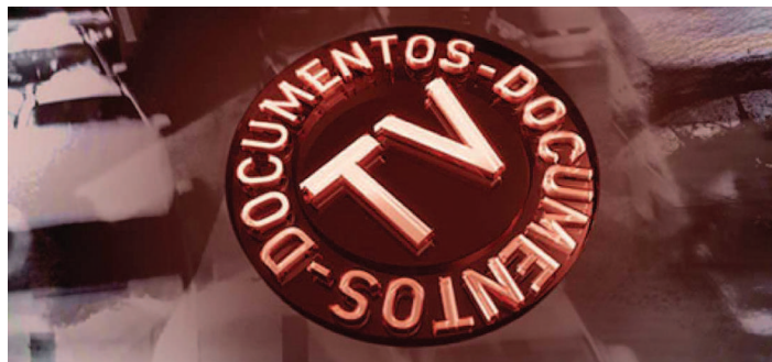
Fig. 5. Imagen del programa documental Documentos TV , de la 2 de TVE.

tajes en sí suelen estar basados en muchas fuentes con alto valor informativo. Se trata de piezas puramente testimoniales. El arranque suele consistir en declaraciones impactantes. La información se va desgranando a través de las propias entrevistas que el periodista realiza en pantalla.