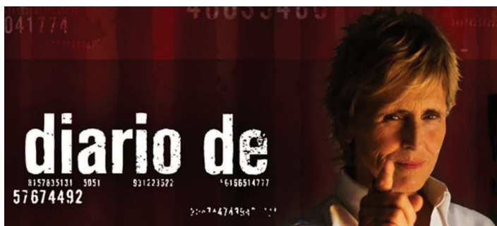
Fig. 2. Imagen del programa documental Diario De , de Tele 5 / Cuatro.