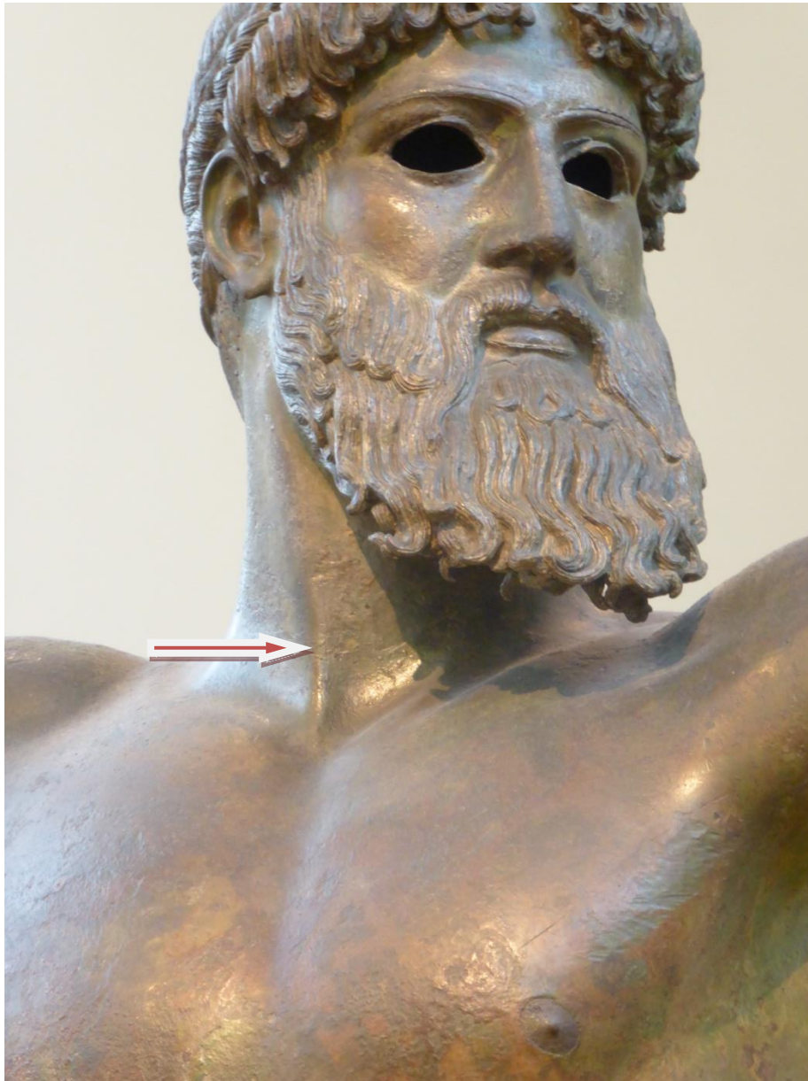
Bild 2. Huvud av Poseidon/Zeus. Konstnären har tydligt modellerat hur musculus sternocleidomastoideus på höger sida spänns när huvudet vrids maximalt åt vänster medan muskeln på vänster sida slappnar av. 42