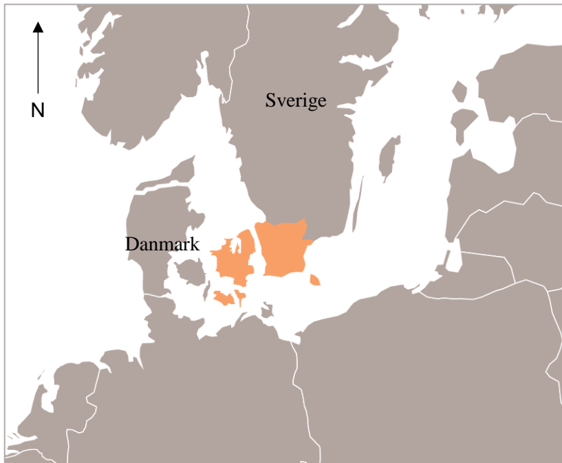
Figur 1 (Greater Copenhagen, u.å.)