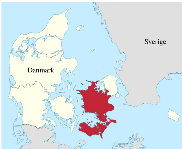
Figur 4 (Wikipedia, 2018 b)