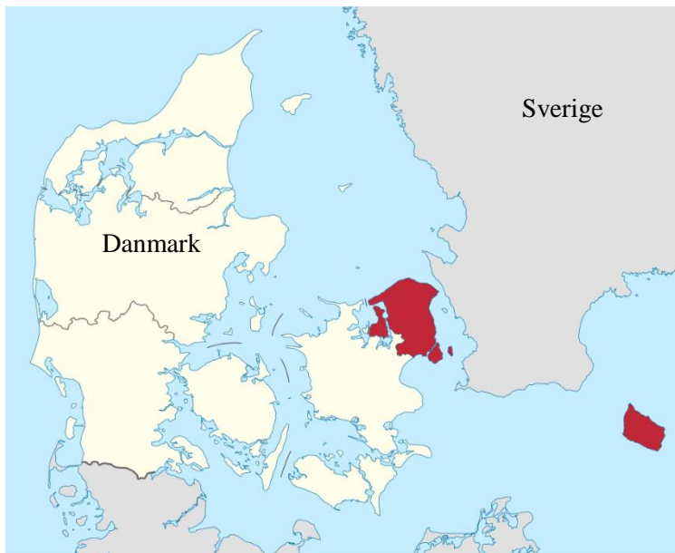
Figur 3 (Wikipedia, 2018 a)