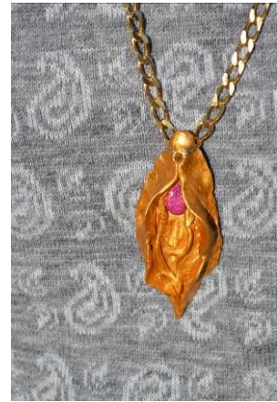
Bild 10, 11, 12: Fittor samt My Little Pony burna som tygpåse, tygpadge på ryggsäck och som smycke.