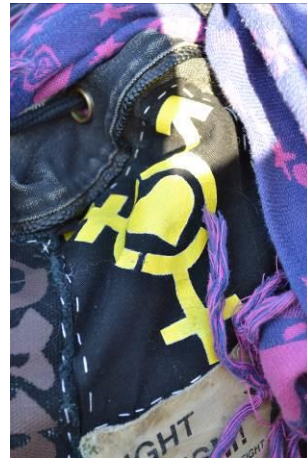
Bild 7, 8, 9: Transsymbolen och transkampssymbolen som smycke, målad som del av tygpadge på baksidan av jacka och som tygpadge på ryggsäck.