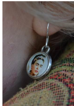
Bild 13, 14, 15: Variant på kvinno- och transsymbolen samt kvinnosymboler, burna som del av banderoll, Pussy Riot som del av banderoll och Frida Kahlo burnen i form av ett smycke.