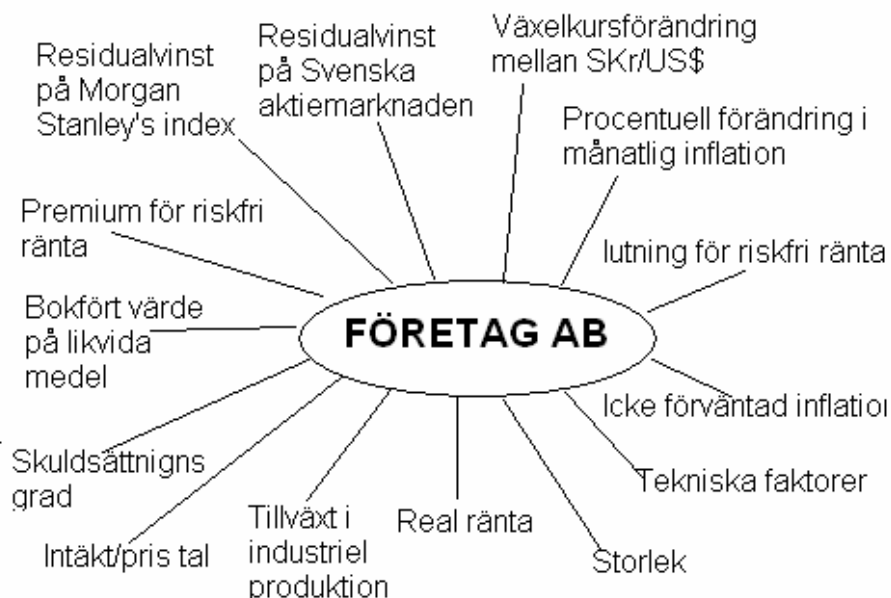
Figur 2.1 Undersökta variabler i Asgharins et al. avhandling.

Som synes i figuren ovan kan variablerna delas in i fyra grupper: marknadsfaktorer, fundamentala faktorer, tekniska faktorer samt makroekonomiska faktorer. Av dessa är det den sista kategorin som fokus kommer att ligga på. På grund av för små undersökta populationen, och outsiders, då några få företag presterade extremt bra under en del av undersökningsperioden, kunde de inte finna något starkt samband för att ovan nämnda variabler påverkade företagets resultat. Dock kommer fokus i detta arbete att hamna på makrovariabler, då omständigheterna när detta arbete skrivs är annorlunda och, rent teoretiskt, bör kunna ge ett annat resultat.