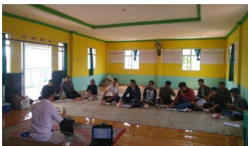
Gambar 3 Tahap Diskusi dan Sharing

Pengumpulan data pada kegiatan ini dilakukan melalui metode wawancara langsung kepada peserta tentang sosialisasi tersebut. Beberapa pertanyaan dari hasil sharing dapat dilihat pada Tabel 1.