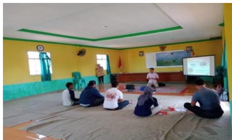
Gambar 2 Pemaparan materi

membudidayakan jangkrik tersebut dan dalam membudidayakannya juga cukup mudah, tidak perlu secara rutin kita cek terus-menerus, kita dapat mendengar suara khas dari jangkrik itu sendiri, kalau dia bersuara tandanya dia sedang bertelur. Pada tahap tersebut, setelah selesai bertelur. Telur yang telah ditiriskan dapat ditetaskan di media pasir, kain kasa atau kain kaos, yang telah ditempatkan dalam kotak, sampai nimfa menetas. Saat, jangkrik sedang bertelur, telur jangkrik itu pun sudah dapat kita jual”.