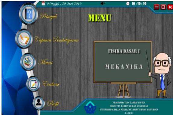
Gambar 2. Tampilan menu

Dosen Fisika Dasar I terhadap media yang telah dibuat.