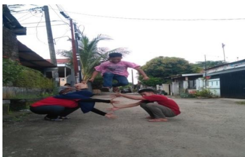
Gambar permainan jangkal

melatih kekuatan kaki untuk melompat kita di ajarkan untuk terus berusaha memecahkan tantangan yang ada mulai dari yang terkecil sampai terbesar ataupun terberat dan tidak boleh menyerah.