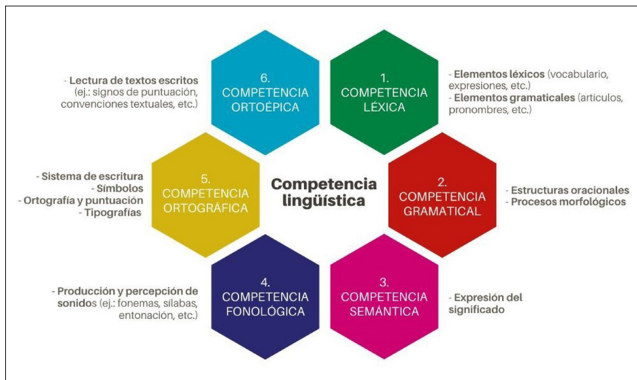
Figura 1. La competencia lingüística y sus componentes.