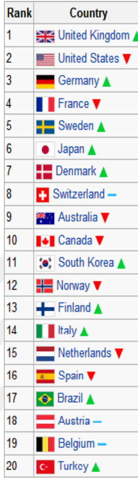
Tablo 4. 2012 Yılı Monocle Dergisi Tarafından Yayımlanan En Fazla Yumuşak Gücü Uygulayan Ülkeler (Soft Power Survey, 2012)

Bu sıralamada etkili olan faktörlere bakıldığında; yönetim standartları, diplomatik gelenek, kültürel etki, eğitim kapasitesi ve iş dünyası açısından kolaylıklar gibi faktörler en önemli yumuşak güç unsurları olarak ön plana çıkmaktadır. Elbette Türkiye'nin yumuşak güç anlamında üst sıralara çıkabilmesinin nedeni yalnızca son yıllarda büyüyen ekonomisi değildir. Türkiye'nin son dönemde televizyon dizileri ve sinema alanında önemli atılım yapan bir ülke olduğu ve özellikle eski Osmanlı coğrafyası olarak nitelendirilen Balkanlar ve Ortadoğu'da halklar tarafından ilgiyle takip edilen bir ülke haline gelmeye başladığı söylenebilir.