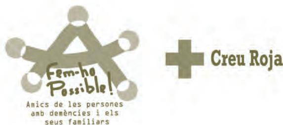
Figura 2 | Segell "Fem-ho possible"