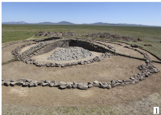
Рис. 1. Курган 11 могильника Серкеты-1: 1 – общий вид кургана в ходе раскопок; 2 – фрагмент кладки из грунтовых блоков

именно в этот период и сооружалось большинство крупных курганов.