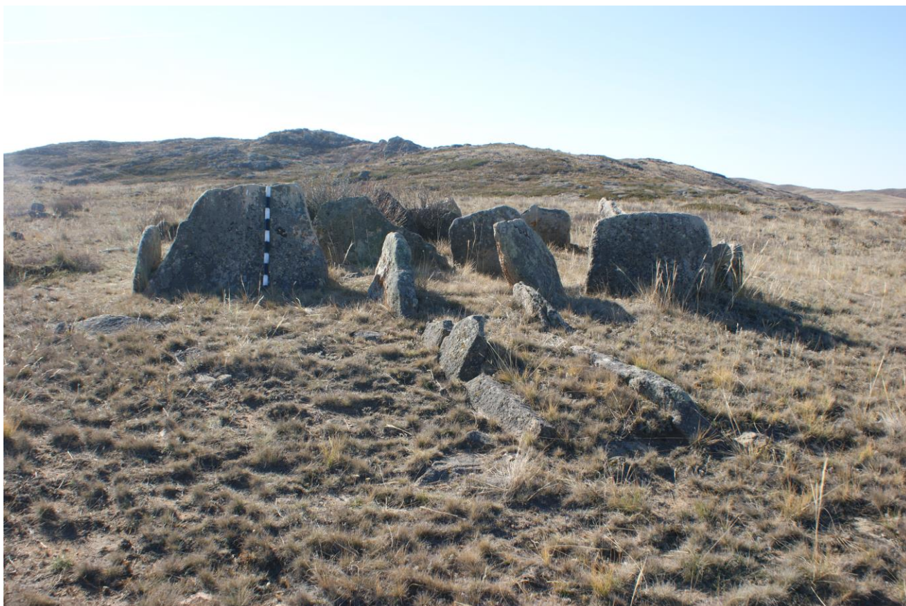
Рис. 4. Ограда 7 могильника Сарыколь. Вид до раскопок

Одной особенностью, появившейся уже на раннем этапе Тасмолы, являются многочисленные околочурганные жертвенники, находимые на территории многих могильников Центрального Казахстана. Как было показано в недавнем специальном сообщении автора [25], они имеют несколько типов в своем исполнении, среди которых наиболее известными являются округло-овальные восьмикаменники и ограды. Находимые в них предметы узды («клады»), по-видимому, связаны с символическим жертвоприношением коня. Также на раннем этапе появляются каменные изваяния. Пять камней найдено в недавних исследованиях автора [26], а вообще, по сведениям специалиста по данной проблеме Л.Н. Ермоленко, в Центральном Казахстане ныне известны 20 изваяний раннего железного века [27]. Близки к каменным изваяниям и стелы (менгиры), найденные в насыпях ряда курганов раннего этапа