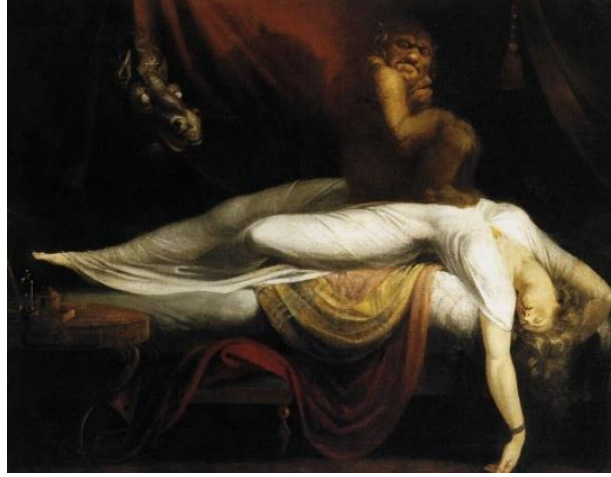
Resim 11: Henry Fuseli, “Karabasan”, Tuvall üzerine yağlıboya,101.5x127 cm, ABD.

resimlerinde insan doğasının en bilinmez yanlarını da resmetmiştir.( sanat atlası,2010,313) Fuseli'nin resimlerinin büyük çoğunluğunda bastırılmış şiddet, korku ve cinsel sapkınlıklar yansımaktadır. Yukarıda adı geçen ve Fusel'nin en önemli başyapıtı olarak bilinen “Kabus” (Resim 11) resmi erotizm ve korkuyu bir arada barındırdığı söylenebilir. Resimde uyuyan kadının karın bölgesinin üzerine oturan yaratık biçimindeki figür, kadının kâbus görmesine sebep olduğu söylenebilir. Resmin sol üst köşesinde, perdenin arkasından bakan ve at başını andıran hayalimsi figürün, kötü bir cini temsil ettiğinden söz edilebilir.