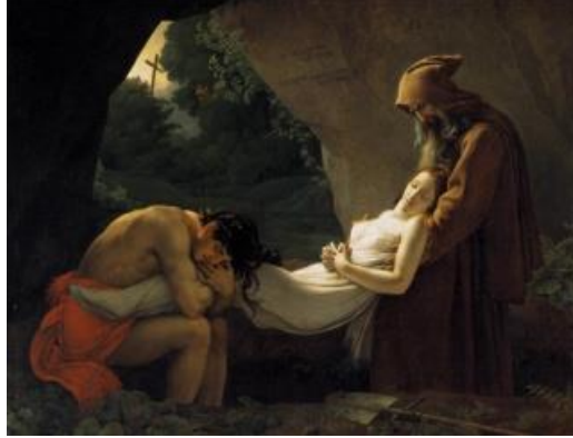
Resim .9: Anne-Louis Girodet “ Burial of Atala” Tuval üzerine yağlıboya,2,07x2,67 cm,