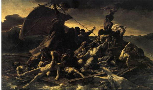
Resim 5: Théodore Géricault, “Medusa’nın Salı”, Tuval üzerine yağlıboya, 491x716 cm, Louvre.

Delacroix’a resimde özgürlüğü, Fransız vatandaşlarının ellerinde tuttuları tüfeklerle ve aynı zamanda, resmin ön planında yer alan ve Fransız bayrağını elinde tutan, bir kadın figürü olarak yansıtmaktadır. Delacroix’ın bu başyapıtındaki dramatik durum, Gericault’un Medusa’nın Salı’ndaki dramı hatırlatmaktadır.