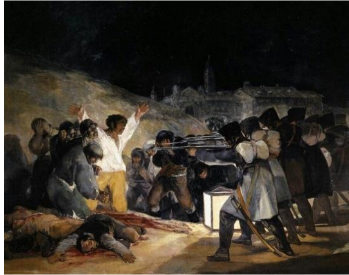
Resim 13: Francisco de Goya, “3 Mayıs 1808” Tuval üzerine yağlıboya, 268 x 347 cm, Madrid