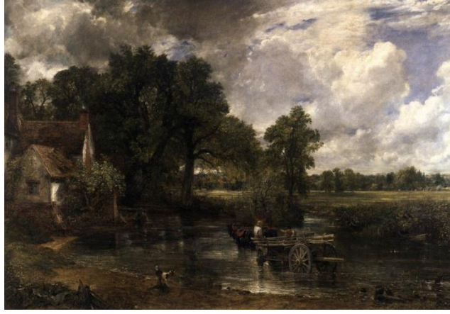
Resim 14 : John Constable “The Hay-Wain” Tuval üzerine yağlıboya 130x185cm

dönüştürmüştür. Constable dünyevi olasılıklara değil, sanatın mutlak dünyasına ait bir ressamdır. Onun için de has bir ressamdır.” (Venturi , 2018,140-141)