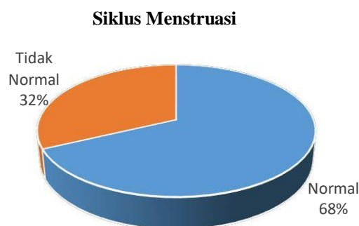
Gambar 3 Diagram Kategori Siklus Menstruasi Responden

Berdasarkan hasil penelitian menunjukkan bahwa sebagian besar responden memiliki siklus menstruasi dalam kategori normal (21-35 hari) berjumlah 34 orang dengan persentase