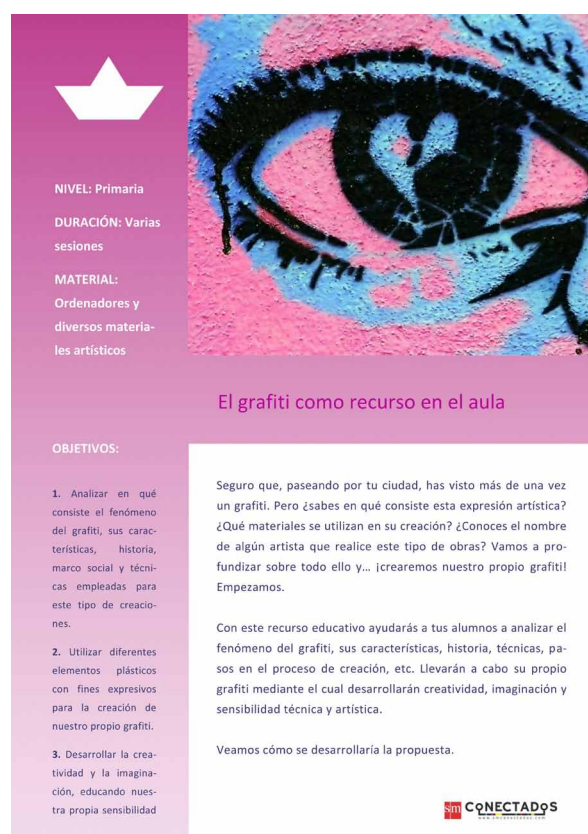
Imagen 1. "El graffiti como recurso en el aula" SM Conectados. Herramientas, recursos didácticos y servicios educativos para profesores.

Este tipo de talleres de graffiti tan comunes no han faltado en Granada. Y lo cierto es que ha existido una gran demanda por parte de los centros educativos desde que comenzó a popularizarse el fenómeno del graffiti en la ciudad en el año 2001, coincidiendo con una época en la que