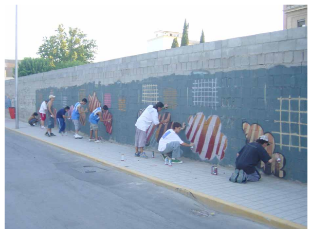
Imagen 3. Estudiantes de ESO ejecutando ejercicios prácticos en uno de los talleres extraescolares de graffiti impartidos por Urban Writers. Santa Fe, Granada. 2005.