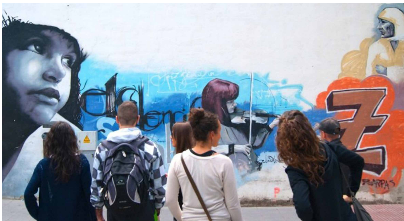
Imagen 9. Participantes en una de las rutas guiadas denominadas “El niño de las pinturas, cuando las paredes hablan”. Granada con Lupa. 2014.

En el proyecto “We Art Urbà” (2014) encontramos la idea de transformación activa de un barrio mediante la observación e intervención colectiva. La Asociación de Vecinos del barrio de Canamunt, en Palma de Mallorca, ante la creciente aparición de un sinfín de intervenciones en las calles del barrio, decidió autodeclararse tolerante ante el arte urbano, aunque eso sí, debían matizar y debatir ciertos asuntos problemáticos de cara al espacio público. Con el apoyo del Museo de Arte Moderno y Contemporáneo Es Baluard —en una apuesta clara por el arte contextual y de intervención—, y coordinado por el investigador y docente Jordi Pallarès, y el artista Joan Aguiló, se efectuaron una serie de actividades en el entorno urbano. Por un lado, se llevaron a cabo