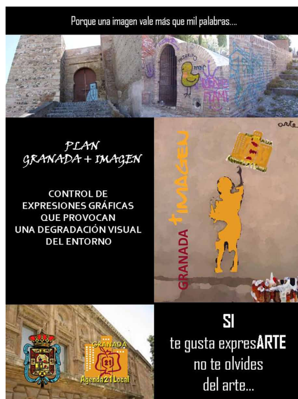
Imagen 7. Folleto informativo Plan Granada + Imagen. Agenda 21 Local, Ayuntamiento de Granada. 2015. Recuperado de http://www.granada.org/inet/agenda21.nsf