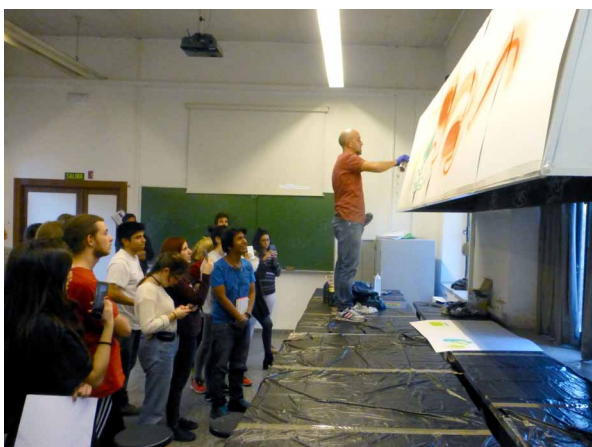
Imagen 5. Masterclass "Profesionalización en el arte a través del graffiti, e introducción a la técnica pictórica del aerosol" dentro de la clase Pintura II: Lenguajes y Procedimientos del Grado en Bellas Artes. Facultad de Bellas Artes, Universidad de Granada. 2017.