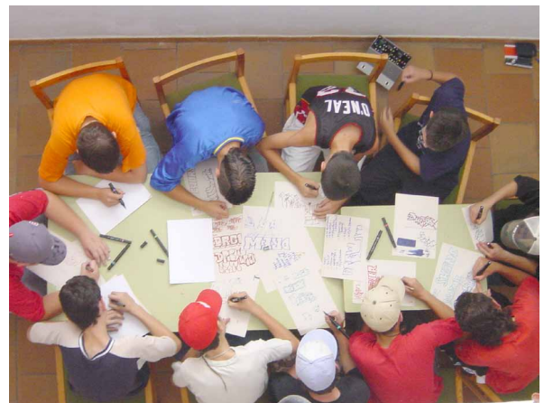
Imagen 2. Estudiantes de ESO realizando bocetos en uno de los talleres extraescolares de graffiti impartidos por Urban Writers. Santa Fe, Granada. 2005.

tica que existía, los diferentes difusores, y demás aspectos técnicos referentes a la técnica del spray; además descubrió que existía una tienda en Granada como Urban Shop, especializada en productos relacionados con en el mundo del graffiti (Pérez, 2014, p. 189).