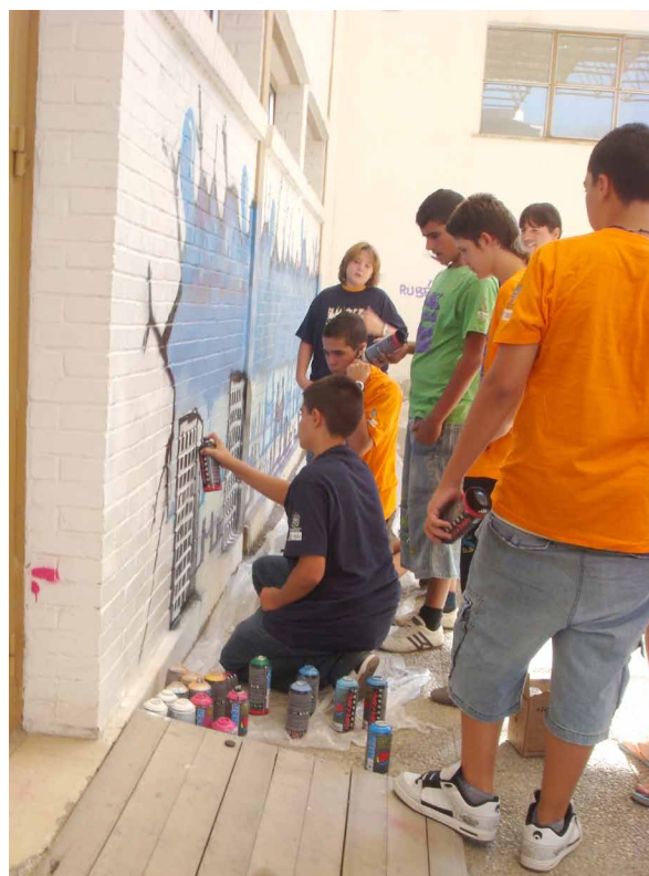
Imagen 4. Jóvenes pintando un mural en el taller de graffiti llevado a cabo en el Centro de Servicios Sociales y Comunitarios de Almanjayar. Granada. 2006.

A partir del año 2005 fue incrementándose el número de talleres extraescolares de graffiti en Granada, siendo en su mayoría cursos de técnica y procedimiento del spray, rematados con la realización de una pintura mural de estética graffiti. Aparte del grupo Urban Writers, que fueron los más afanosos en este ámbito, otros escritores locales como Reti, El niño de las pinturas, Ruby, Sovri o Cheko —por mencionar algunos—, participaron en proyectos similares y por diferentes motivos. Un caso especialmente llamativo fue el del escritor almeriense Stook, afincado en Granada por aquellos años. Stook, además de ser