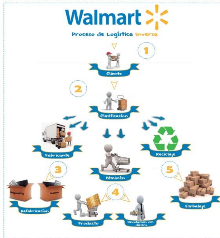
Diagrama No. 2 Logística Inversa Walmart

E. Estrategia de Logística Inversa y Verde: una vez realizada la venta del bien, Walmart utiliza este modelo, para el caso que se produzcan productos defectuosos, con el fin de que los consumidores estén confiados y satisfechos; según un estudio realizado por Mejía (2017) en la cual realizó una visita de campo a uno de los centros de distribución de Walmart, pudo observar las actividades que tienen que ver con los procesos de logística inversa, los cuales se describen de la siguiente manera: