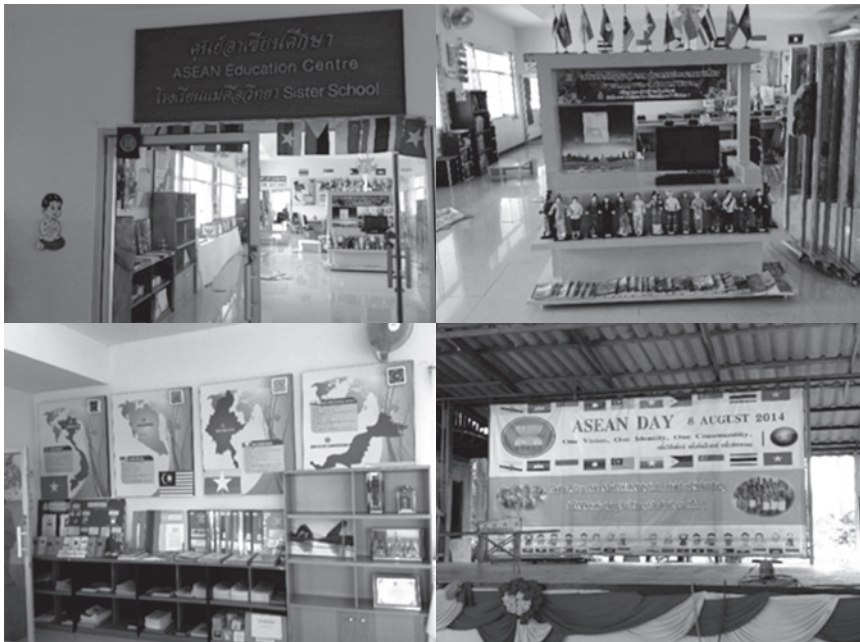
▲ ASEAN 教育パイロット校（ASEAN 教室，イベントステージ）

パイロット校の実践事例として，Sister Schoolであるタイ北部チェンマイ県のメーカーウィットヤー機会拡張学校 19 では，初等1年の時から外国語の学習に力を入れており，英語・中国語，そしてASEAN言語であるビルマ語を指導している。基本的にはタイ人の教師が教えるが，ネイティブスピーカーによる授業も実施していた時期もあった。ビルマ語に関してはミャンマー人の教員を採