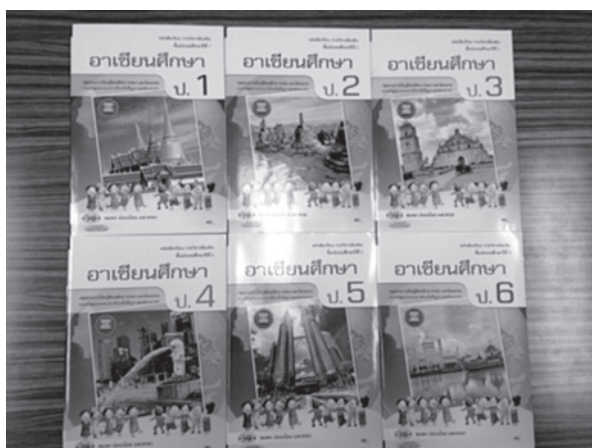
▲ワットナーパーニット社発行の副読本

ASEAN 教育は、SEAMEO のガイドラインに基づいてタイ教育省が指針を示してはいるものの実際の指導法・運用方法は各学校・各教員に任されており、教育の質に相違があることが課題となっ