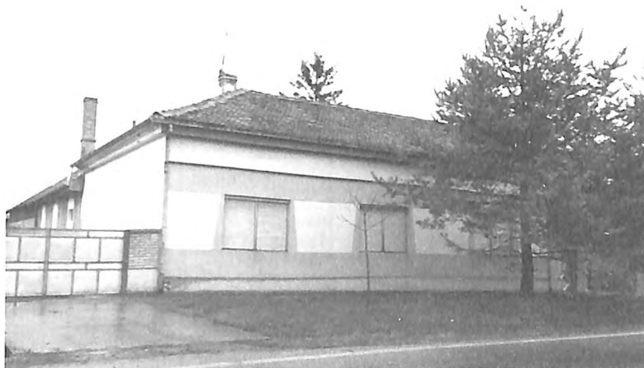
Kuća na mestu erdevičkog templja (Pinkijeva 15, Erdevik)

Matične knjige Izraelske bogoštovne opštine u Erdeviku su sačuvane za period od 1849. do 1940. godine. U nekim godinama se nalaze naknadno upisane osobe rođene pre 1849. U periodu od 1914. do 1930, za godine u kojima nije bilo rođenja, venčanja i smrti, rabiner je to naglasio. Sve matice imaju obrasce, sa legendama na srpskom jeziku, pisane latinicom. Gotovo svi upisi su na nemačkom jeziku. U svega par slučajeva prezime je pisano srpskom transkripcijom.