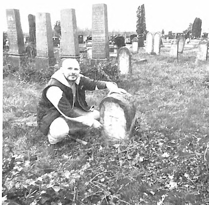
Jevrejsko groblje u Erdeviku