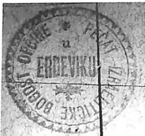
Pečat erdevičke opštine iz 1912.

Skoro svi erdevički Jevreji koji su početak rata dočekali u selu stradali su u Holokaustu. Erdevički tempel je zapaljen 1941. godine.