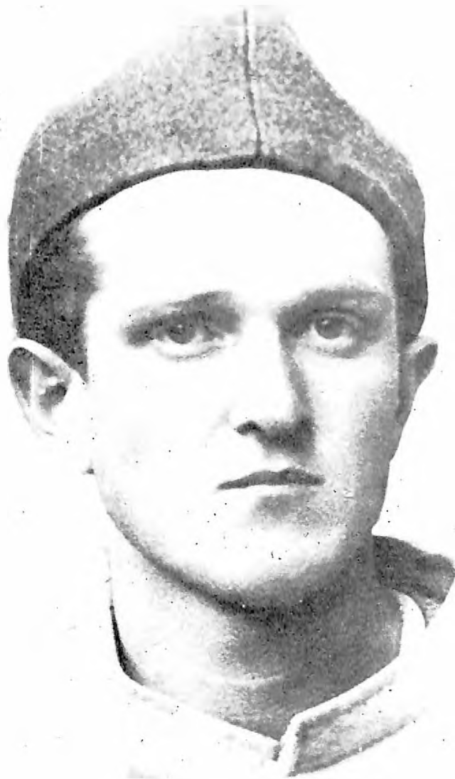
Pavle Pap, član CK KPJ, narodni heroj, poginuo avgusta 1941.