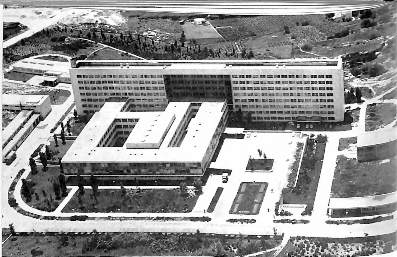
Maketa vojne bolnice u Splitu koja nosi naziv »Dr Izidor Perera-Matić«.