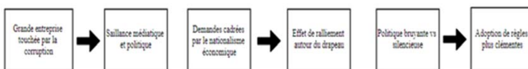
Figure 1 : Chaîne causale du pouvoir politique des firmes visées par la corruption

Le processus proposé pour rendre compte du pouvoir politique des firmes visées par la corruption se déroule en trois séquences sur une période de sept années consécutives (2011-18). Dans l'étude d'une chaîne de mécanismes causaux qui s'étend dans le temps, l'ordre des séquences est important (Pierson, 2004). La première commence par des scandales frappant une grande entreprise et prédit, à la suite des analyses de la saillance, que cet événement devrait être « bruyant » dans les médias, et inciter les partis politiques à intervenir plus fortement sur le front de la lutte contre la corruption pour gagner des votes. La deuxième