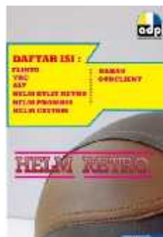
Gambar 15 Final Artwork Daftar Isi.

Halaman daftar isi berisi foto produk dengan tata letak atau layout yang menarik dan font yang digunakan dalam halaman ini adalah Revisal dan Minion Pro .