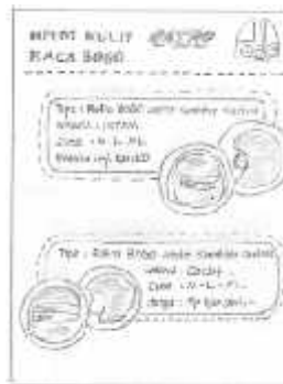
Gambar 12 Layout Kasar Halaman 8

Halaman 8 berisikan foto produk yaitu Helm Retro Kaca Bogo serta penjelasan tipe warna, size, harga. Font yang digunakan dalam halaman ini adalah Revisal dan Helvetica .