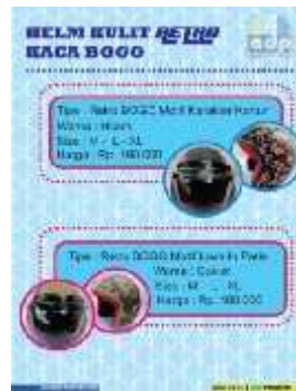
Gambar 23 Final Artwork Halaman 8

Halaman 8 berisikan foto produk yaitu Helm Retro Kaca Bogo serta penjelasan tipe warna, size, harga. Font yang digunakan dalam halaman ini adalah Revisal dan Helvetica .