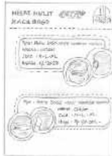
Gambar 11 Layout Kasar Halaman 7

Halaman 7 berisikan foto produk yaitu Helm Retro Kaca Bogo serta penjelasan tipe warna, size, harga. Font yang digunakan dalam halaman ini adalah Revisal dan Helvetica .