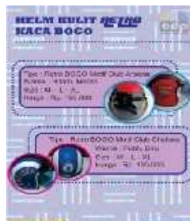
Gambar 24 Final Artwork Halaman 9