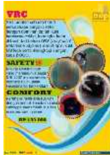
Gambar 17 Final Artwork Halaman 2

Halaman 2 berisi foto satu brand dari perusahaan yaitu VRC serta menjelaskan keunggulan yang dimiliki salah satu brand perusahaan ini. Font yang digunakan dalam halaman ini adalah Revisal .