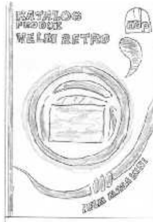
Gambar 3 Layout Kasar Cover Depan

Cover Headline pada promosi ini menggunakan kata : “KATALOG PRODUK HELM RETRO BERGAYA MASA KINI” dengan isi tulisan judulnya berwarna biru sedangkan PT. Anugerah Duta Pratama berwarna hitam. Font yang digunakan pada halaman ini adalah Revisal Bold , Regular , Ultra thin dan hairline .