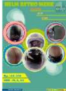
Gambar 19 Final Artwork Halaman 4

Halaman 4 berisikan seluruh brand yang diproduksi PT. Anugerah Duta Pratama . Font yang digunakan dalam halaman ini adalah Revisal .