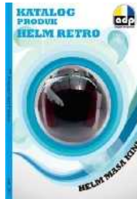
Gambar 14 Final Artwork Cover Depan.

Cover Headline pada promosi ini menggunakan kata : “KATALOG PRODUK HELM RETRO BERGAYA MASA KINI” dengan isi tulisan judulnya berwarna biru sedangkan PT. Anugerah Duta Pratama berwarna hitam. Font yang digunakan pada halaman ini adalah Revisal Bold , Regular , Ultra thin dan hairline .