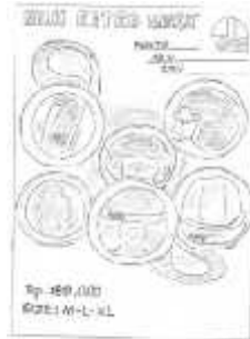
Gambar 8 Layout Kasar Halaman 4

Halaman 4 berisikan seluruh brand yang diproduksi PT. Anugerah Duta Pratama. Font yang digunakan dalam halaman ini adalah Revisal .