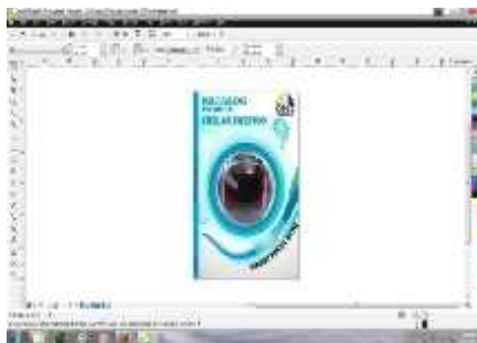
Gambar 2 Tampilan Area Kerja Corel Draw.

CorelDraw adalah sebagai dasar pemahaman seni menggambar di komputer, yang lebih menekankan pada teknik penggunaan fasilitas dasar pada software berbasis CAD ( Computer Aided Design )