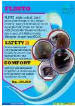
Gambar 16 Final Artwork Halaman 1

Halaman 1 berisi foto satu brand dari perusahaan yaitu FLINTO serta menjelaskan keunggulan yang dimiliki salah satu brand perusahaan ini. Font yang digunakan dalam halaman ini adalah Revisal .