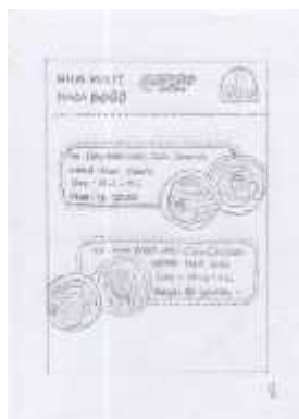
Gambar 13 Layout Kasar Halaman 9