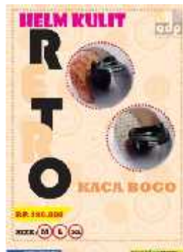
Gambar 21 Final Artwork Halaman 6