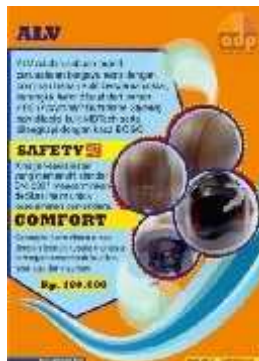
Gambar 18 Final Artwork Halaman 3