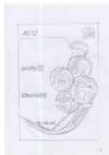
Gambar 7 Layout Kasar Halaman 3