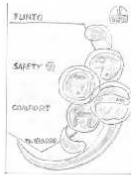
Gambar 5 Layout Kasar Halaman 1

Halaman 1 berisi foto satu brand dari perusahaan yaitu FLINTO serta menjelaskan keunggulan yang dimiliki salah satu brand perusahaan ini. Font yang digunakan dalam halaman ini adalah Revisal .