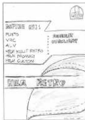
Gambar 4 Layout Kasar Daftar Isi.

Halaman daftar isi berisi foto produk dengan tata letak atau layout yang menarik dan font yang digunakan dalam halaman ini adalah Revisal dan Minion Pro .