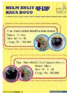
Gambar 22 Final Artwork Halaman 7

Halaman 7 berisikan foto produk yaitu Helm Retro Kaca Bogo serta penjelasan tipe warna, size, harga. Font yang digunakan dalam halaman ini adalah Revisal dan Helvetica .