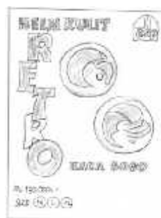
Gambar 10 Layout Kasar Halaman 6