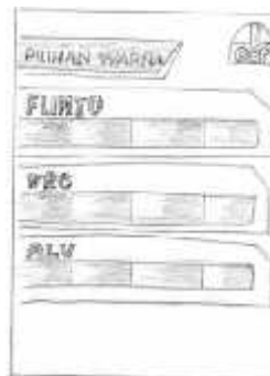
Gambar 9 Layout Kasar Halaman 5

Halaman 5 berisikan pilihan warna helm merek FLINTO, VRC, dan ALV. Font yang digunakan dalam halaman ini adalah Revisal Minion Pro .