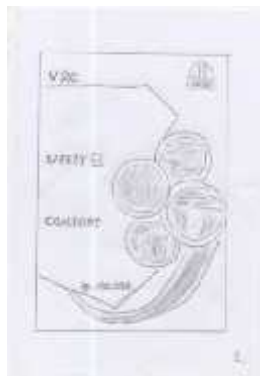
Gambar 6 Layout Kasar Halaman 2

Halaman 2 berisi foto satu brand dari perusahaan yaitu VRC serta menjelaskan keunggulan yang dimiliki salah satu brand perusahaan ini. Font yang digunakan dalam halaman ini adalah Revisal .