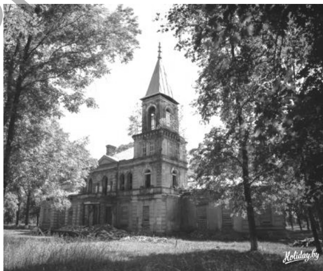
Рисунок 6 – Вид на боковой фасад

Парковый комплекс представляет интерес с точки зрения исторической значимости. Внимание туристов можно повысить путем установки информационных аншлагов.