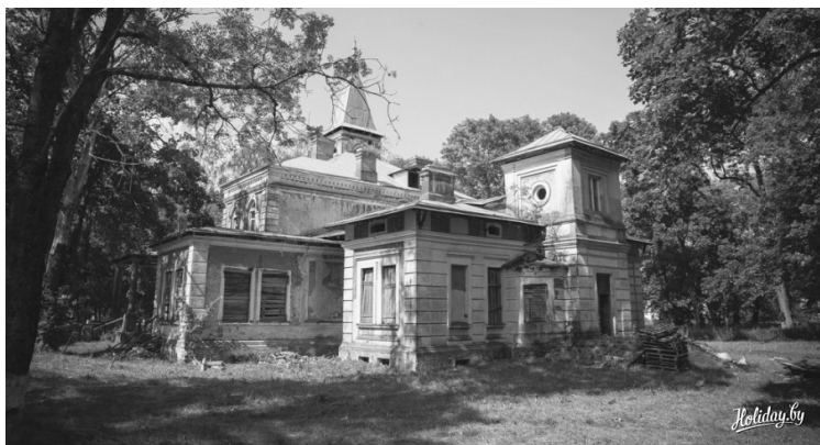
Рисунок 5 – Вид на главный фасад

женная [2, с. 201]. Аллея пересекает всю усадьбу. Западная часть парка перепланирована в регулярном стиле с использованием в линейных посадках липы, каштана конского, дуба красного. Древесные группы парка состоят в основном из местных видов – клена, березы, липы сердцелистной. Количество экзотов небольшое, среди них выделяется Веймутова сосна, лиственница европейская, дуб красный и орех маньчжурский. Данные деревья выделяются большими размерами.