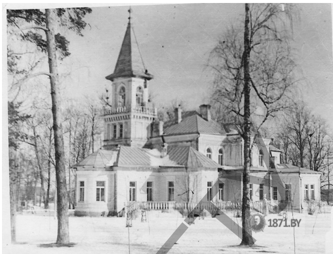
Рисунок 3 – Усадьба зимой