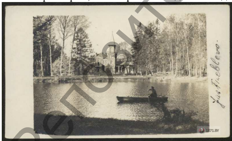
Рисунок 4 – Вид на усадьбу с берега

Главный парадный вход смещен от центральной оси здания. Вертикальной доминантой является четырехъярусная башня, завершенная высоким шатром, увенчанная флюгером, на котором стоит дата возведения дома – 1897 год. К основному корпусу примыкают боковые объемы. Парадный фасад подчеркнут плоским ризалитом с балконом на двух столбах, имеет пандус с балюстрадой. Сейчас здание законсервировано. Ранее в составе усадьбы были две офицеры (по 12 комнат), каплица-усыпальница (сохранился фундамент у северо-восточной окраины парка, вблизи от современной жилой застройки), хозяйственные постройки, винокурня, собственная пивоварня, конюшня, хозяйственные постройки (сейчас здесь располагается производственный цех). Усадебно-парковый комплекс находится в окружении жилой и производственной застройки и испытывает сильное антропогенное воздействие. На территории ансамбля построены два многоэтажных здания интерната, разрушены усыпальница и конюшня. Территория парка сейчас находится в ведении школы-интерната.