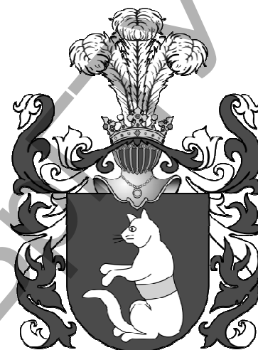
Рисунок 1 – Герб рода Котлубаев