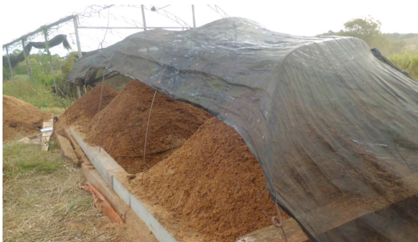
Figura 1. Leiras de Compostagem, Frederico Westphalen – RS, 2012.

O presente estudo foi realizado no campus da Universidade Federal de Santa Maria – UFSM na cidade de Frederico Westphalen – RS, localizada a uma latitude 27° 21' 33" S e a uma longitude 53° 23' 40" O e altitude de 566 metros. Sua população, de acordo com a estimativa para 2009 é de 28295 habitantes. O município possui uma área