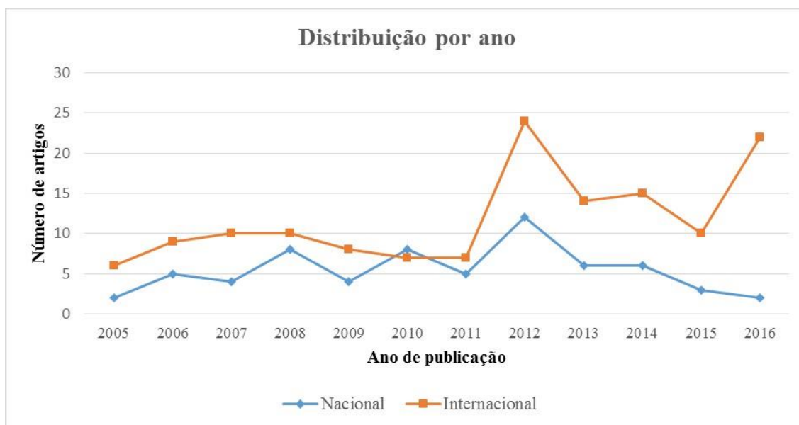
Figura 1 – Número de artigos nacionais e internacionais publicados em cada ano

específico sobre o tema. No ano de 2012, houve um aumento dos artigos em ambos os contextos, nacional e internacional. Após um período de quedas, em 2016 os artigos internacionais voltaram a ter um crescimento importante (Figura 1):