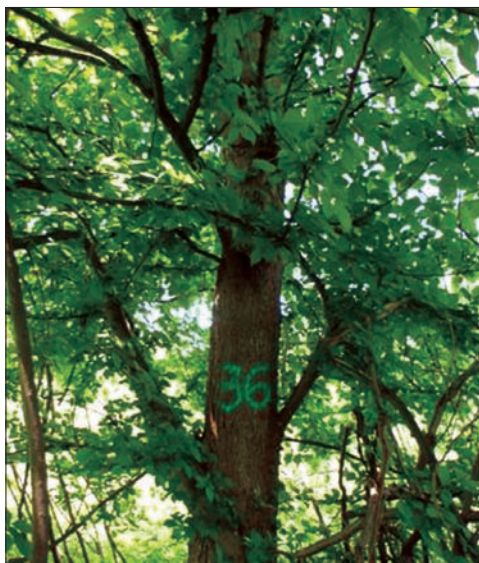
Слика 1. Обележена стабла веза ( Ulmus effusa Willd.) на Великом ратном острву