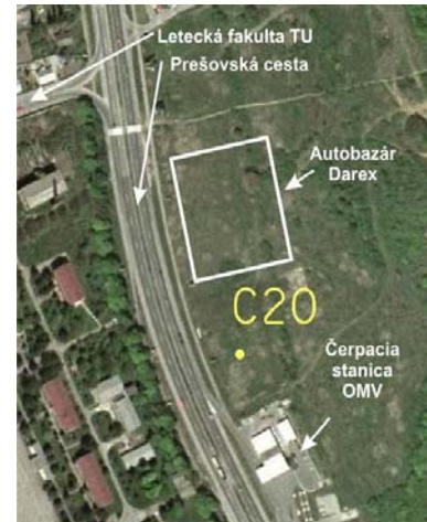
Obr. 1. Situácia bodu C-20. Fig. 1. Situation of point C-20.

Meranie dňa 19. 3. 2008 sa vykonalo rovnakým postupom ako 12. 3. 2008. Prístroj Leica GPS900CS, ktorá môže prijímať údaje aj z družíc GLONASS, preto sa striedavo nastavoval príjem údajov z družíc GNSS a GPS.