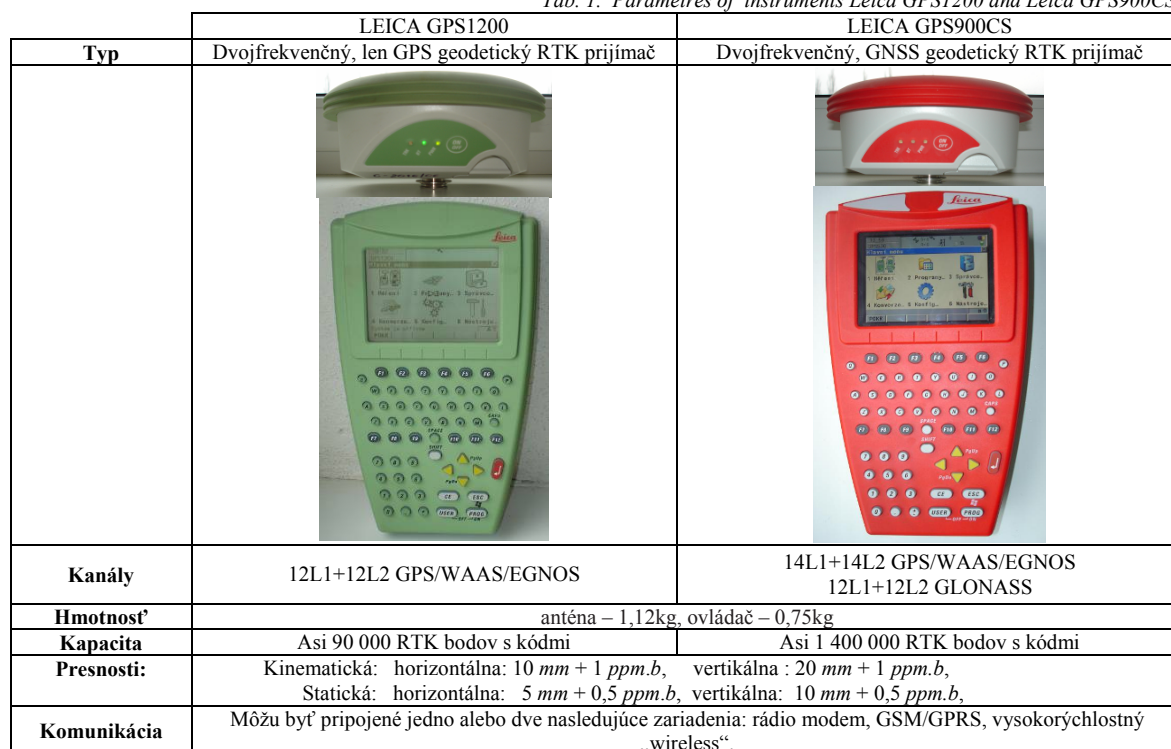
Tab. 1. Parametre prístrojov Leica GPS1200 a Leica GPS900CS. Tab. 1. Parameters of instruments Leica GPS1200 and Leica GPS900CS.

Na meranie boli použité prístroje Leica GPS900CS a Leica GPS1200. Tab. 1 obsahuje predovšetkým parametre, ktorými sa tieto dva prístroje odlišujú. Ďalšie parametre sú uvedené v manuáloch príslušných prístrojov.