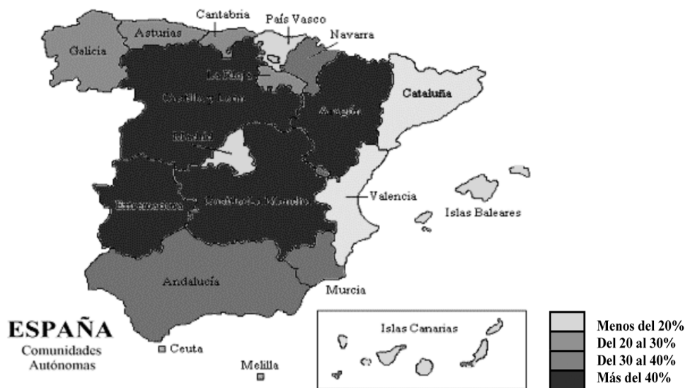
Mapa 2. Estimación del Apoyo Total (TSE) por CCAA: porcentaje del PIB (promedio 2002-2006)

Fuente: Elaboración de los autores a partir de OCDE, MAPA y FEAGA.