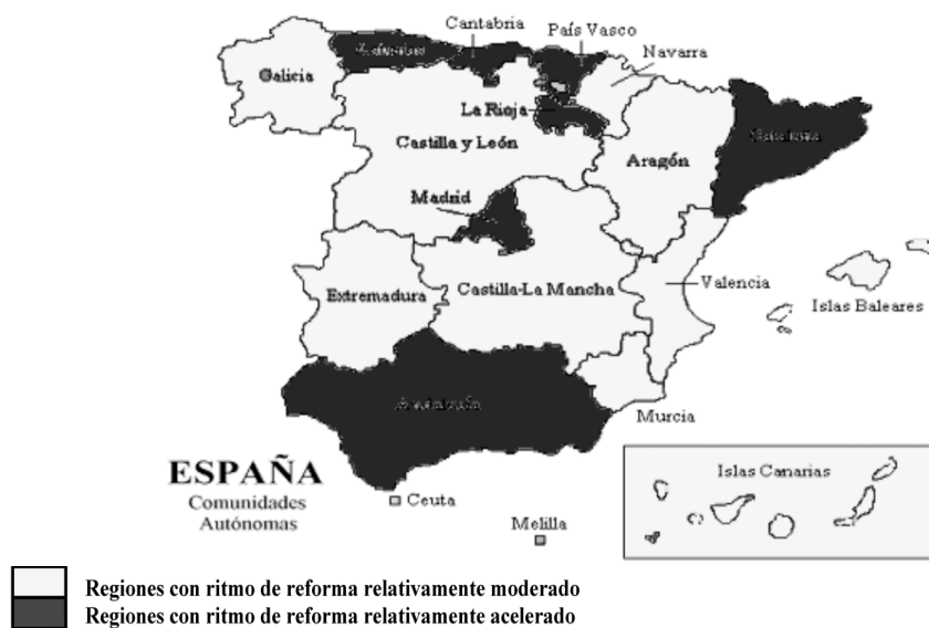
Mapa 3. Clasificación de las CCAA según el ritmo de reforma en políticas agrarias