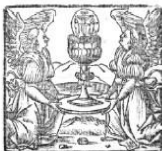
Fig. 6. Anónimo. Portada del libro