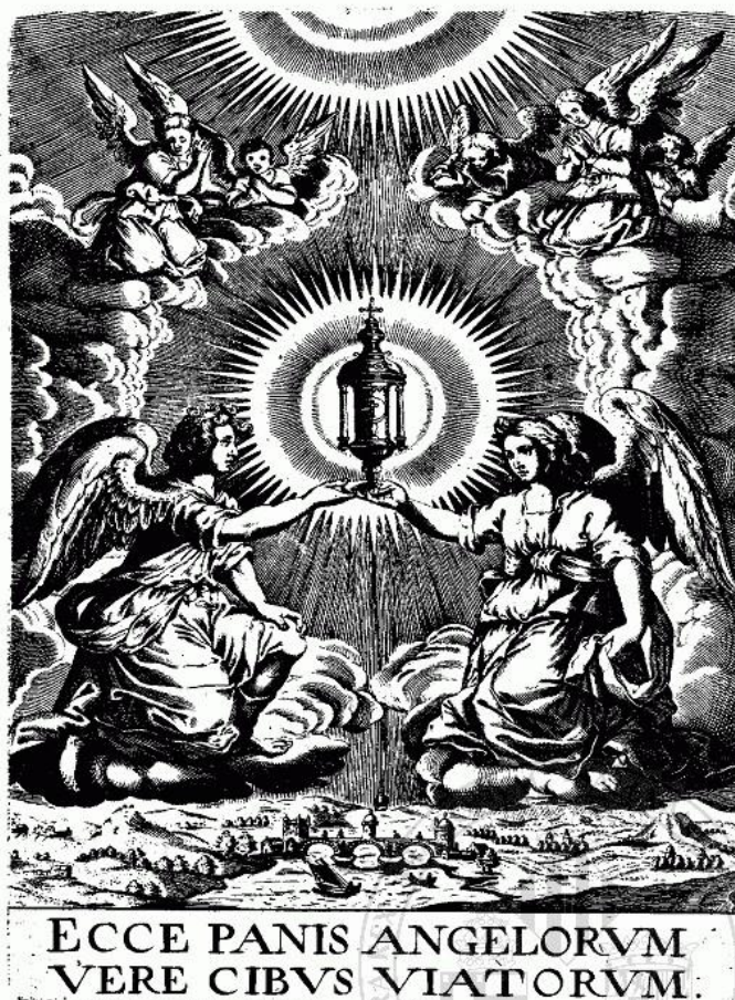
Fig. 2. Anónimo. Ángeles adorando al Santísimo Sacramento. Estampa dispuesta en el verso del folio que sigue a la portada de La Historia Sacra del Santissimo Sacramento contra las heregias destes tiempos , Madrid, 1626. Talla dulce. Universitat de València, Biblioteca Histórica, BH Y-12/063.

Como ya señalábamos al comienzo de este artículo, este libro presenta una segunda estampa en la que se vuelve a insistir en el tema eucarístico 38 . Esta estampa se sitúa en el verso del folio que sigue a la portada, y al igual que ésta carece de las firmas del inventor y del grabador y se trata de una estampa abierta a la talla dulce (Fig. 2).