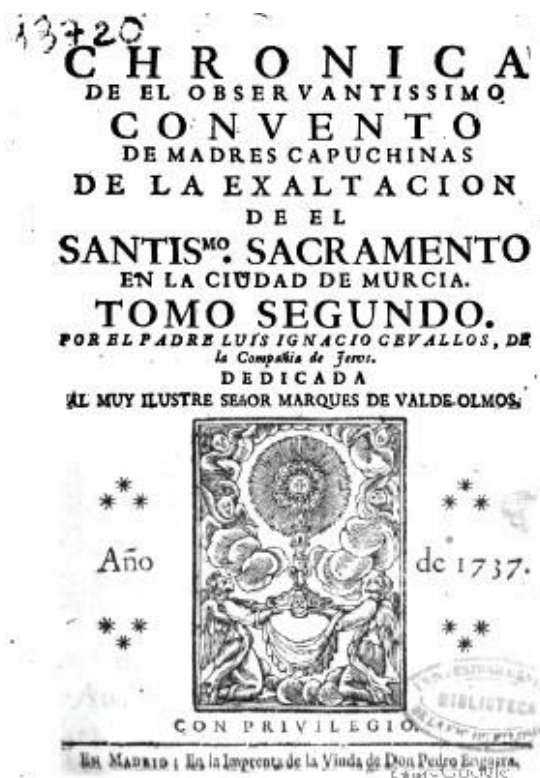
Fig. 7. Anónimo. Portada del libro

Tercera parte del teatro de los dioses de la