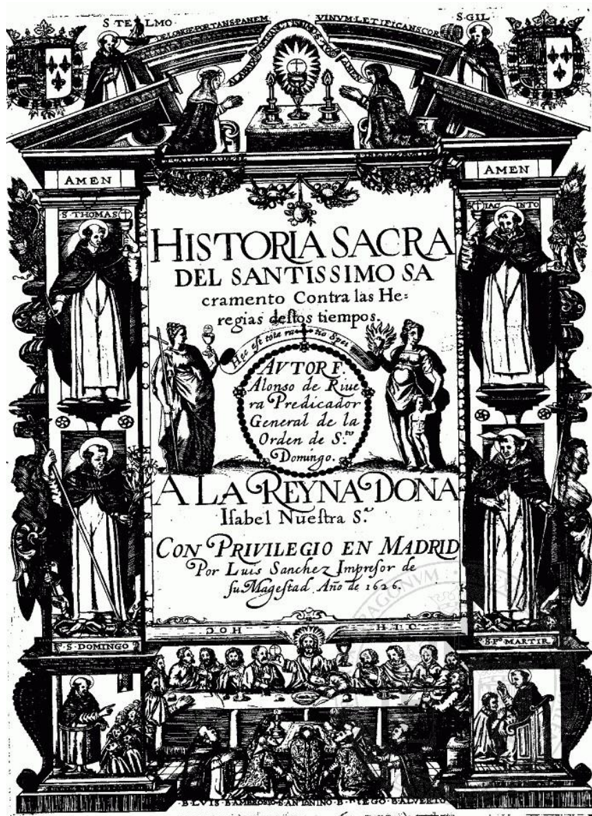
Fig. 1. Anónimo. Portada del libro La Historia Sacra del Santissimo Sacramento contra las heregias destes tiempos , Madrid, 1626. Talla dulce. Biblioteca Histórica Marqués de Valdecilla, Universidad Complutense de Madrid, BH FLL 421.