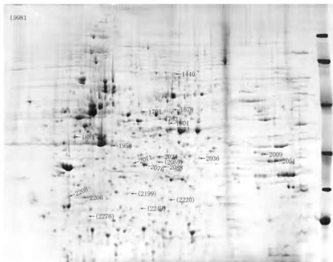
图1 L9981与L9981-nm23-H1间差异表达的蛋白质点 Fig 1 Protein spots differentially expressed in L9981 compared with L9981-nm23-H1. Spot ID in bracket indicates the protein that was only detected in L9981; Spot ID no in bracket indicates the protein whose %vol in L9981 was more than two times higher than that in L9981-nm23-H1.