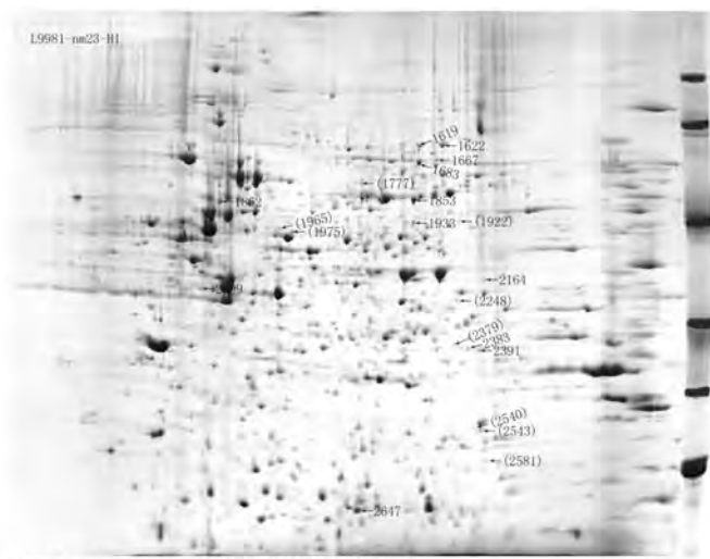
图2 L9981与L9981-nm23-H1间差异表达的蛋白质点 Fig 2 Protein spots differentially expressed in L9981-nm23-H1 compared with L9981. Spot ID in bracket indicates the protein that was only detected in L9981-nm23-H1; Spot ID no in bracket indicates the protein whose %vol in L9981-nm23-H1 was more than two times higher than that in L9981.